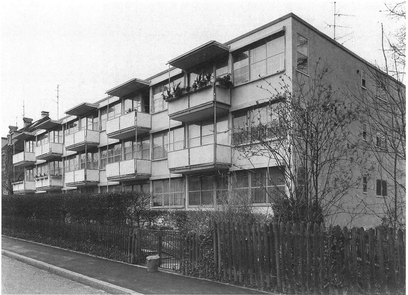
2 Basel, Haus für alleinstehende Mütter, Speiserstrasse 98. Architekten H. Schmidt und Paul Arteria 1928–29.

betreffend Bauten des 20. Jahrhunderts die Londoner Behörden aus der grossen Zahl noch gerade jene Bauten in das Schutzverzeichnis aufgenommen, die mit einem Steildach bedeckt sind 5 , und mir hat manch einer der vor dem Zweiten Weltkrieg Geborenen bestätigt, dass ein Einfamilienhaus doch nur mit einem Dach «heimelig» sei. Die herrliche St.-Antonius-Kirche in Basel, die 1925–27 von Karl Moser errichtet wurde, wird heute noch von vielen als «hässlich» bezeichnet, auch wenn niemand gegen die jetzigen kostspieligen Konservierungsarbeiten dieses schweizerischen Hauptwerkes jener Zeit ernsthaft opponiert.