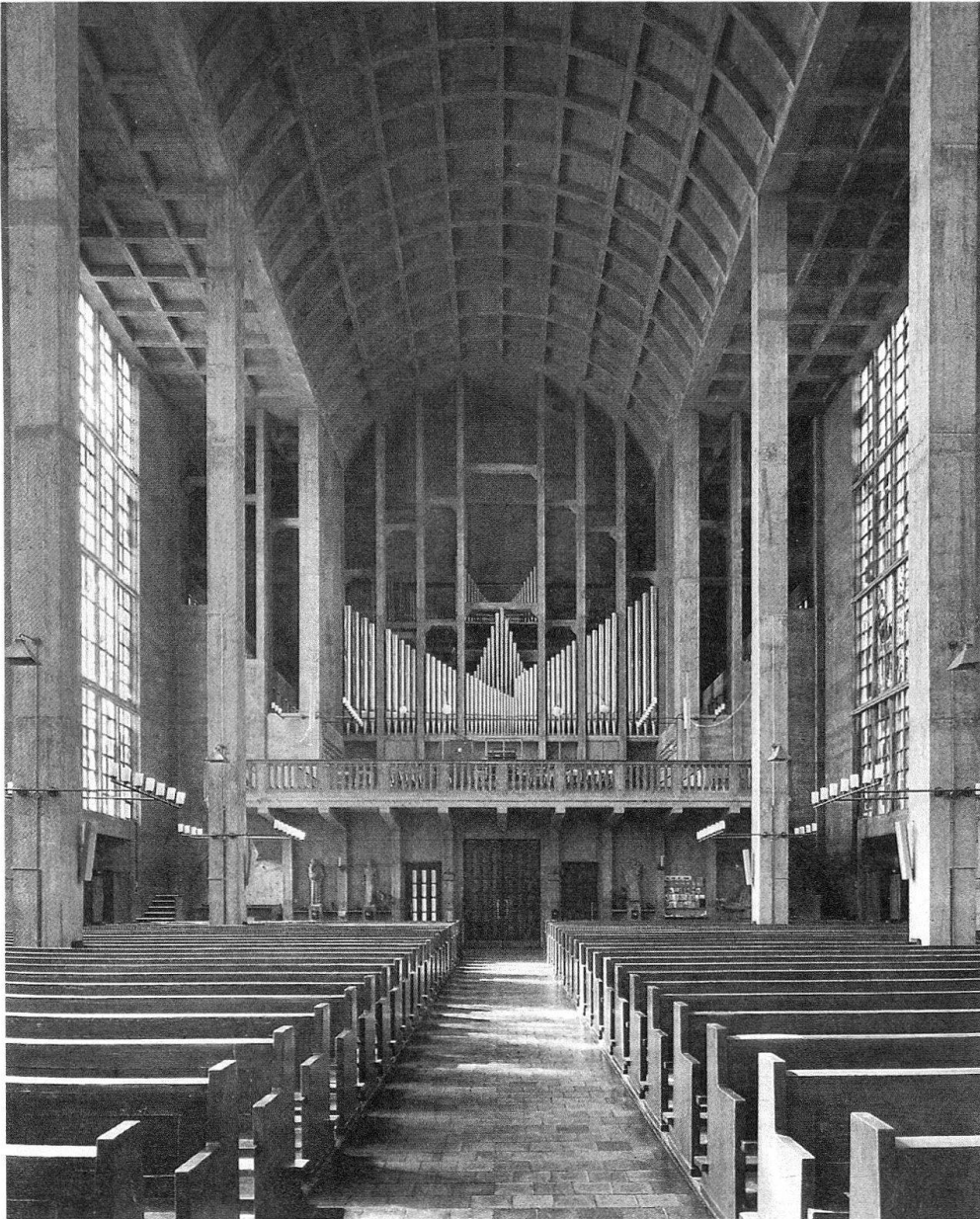
1 Basel, St. Antonius, Inneres gegen die Orgel. Architekt Karl Moser 1925–27.