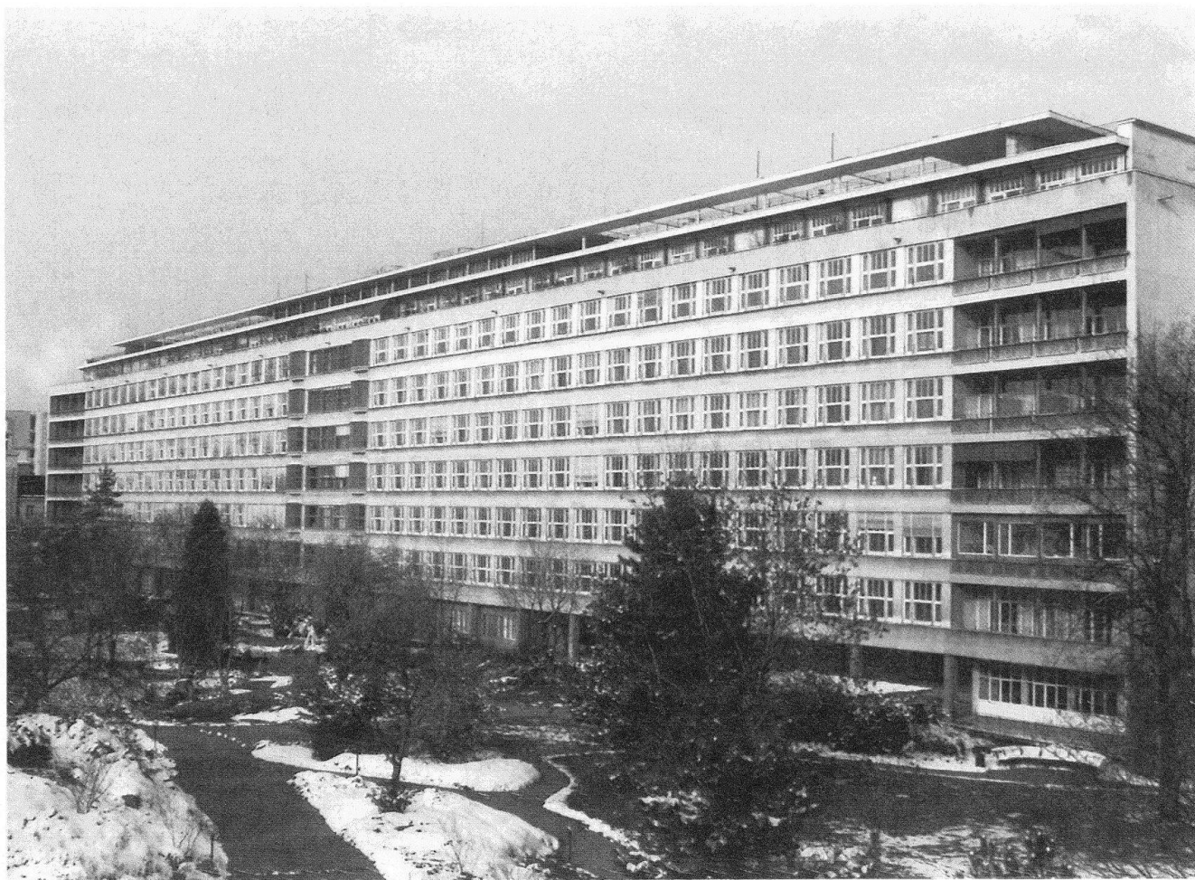
4 Basel, Kantonsspital. Architekten Hermann Baur, F. Bräuning, H. Leu und A. Dürig, E. und P. Vi- scher, 1940–45, nach ei- nem älteren Konzept von H. Baur.

Es möge dieser Versuch, die Motive einer latenten Renitenz gegen die Erhaltung der Bauten der «Neuen Sachlichkeit» aufzuzeigen, dem Leser überzeichnet und einseitig erscheinen, die denkmalpflegerische Praxis scheitert oft an solchen Vorurteilen. Ihre Überwindung mag eine Generationsfrage sein – doch fehlt uns die Zeit zum Warten. Die Probleme der Erhaltung sind wegen der technischen Schwächen mancher Konstruktionen der damaligen Zeit, wegen der fehlenden Isolationen und der oft engen Grundrisse – man denke an «die Wohnung für das Existenzminimum» – dringlich zu lösen.