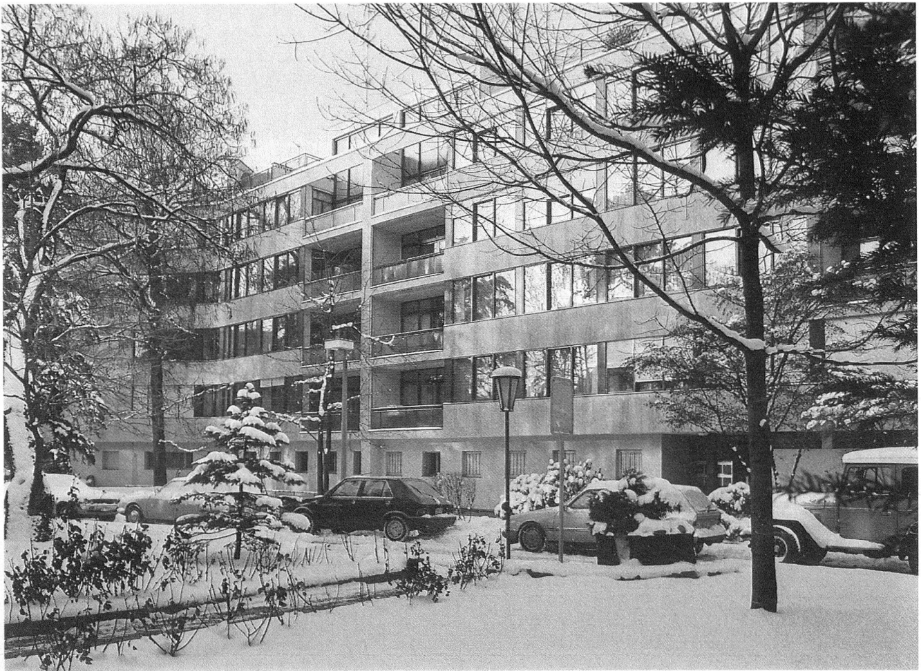
6 Basel, Mehrfamilienhaus St.-Alban-Anlage 37–39. Architekten O. Senn und R. Mock 1935.

kömmlichen Bauweisen und Baumaterialien verhaftet bleiben und baumeisterlich ausgeführt sind. Zu diesen baumeisterlichen Werken gehören auch die damals so bezeichneten «Traditionalisten», wie Tessenow, Schmidhenner, Riemerschmid und andere. Gewiss wird der Kunsthistoriker die Grenzen nicht so scharf ziehen wollen und auf die Vorgeschichte hinweisen, auf die neuen Materialien Eisen, Glas und Stahibeton im 19. Jahrhundert, die Versuche zur serienmäßigen Erstellung der Konstruktionselemente und auf die Vorläufer im Gestaltungsbereich 14 . Die Herausarbeitung der Wurzeln ist gewiss das interessantere Thema als die Definition des Beginns einer Epoche, und es werden denn auch die daraus gewonnenen Argumente sein, welche die Qualifikation der Denkmäler begründen. Wichtig ist in der Denkmalpflegepraxis die Frage nach dem Ende. Gewiss bedeutet die Nachkriegszeit in vielem einen Neubeginn, vor allem in den unter den Kriegszerstörungen leidenden Ländern: Wiederaufbau, neue politische und soziale Situation. Die «Neue Sachlichkeit» scheint abgeschlossen, vor allem wenn man die Wirkung des Faschismus und die Tendenzen zu repräsentativen klassizistischen Formen am Ende der dreissiger Jahre bedenkt. Doch wird man bei einer breiter angelegten Betrachtung ein Kontinuum deutlich sehen: in der individuellen Entwicklung der Pioniere – von denen Le Corbusier den Architekturvorstellungen durch seine plastischen Werke neue Dimensionen gegeben hat – und in einer grossen Menge von