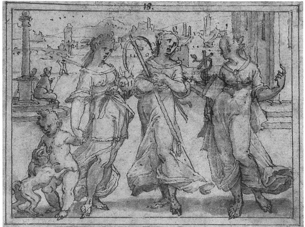
3 Christoph Murer, Fides, Spes, Charitas. Feder, laviert. Vorzeich- nung zur Radierung. Ba- sel, Kupferstichkabinett.

Versal buchstaben / Historj, vnd was man wil haben / Kuenstlich, daß nit ist außzusprechen / Auch kan ich diß in Kupffer stechen.» 8