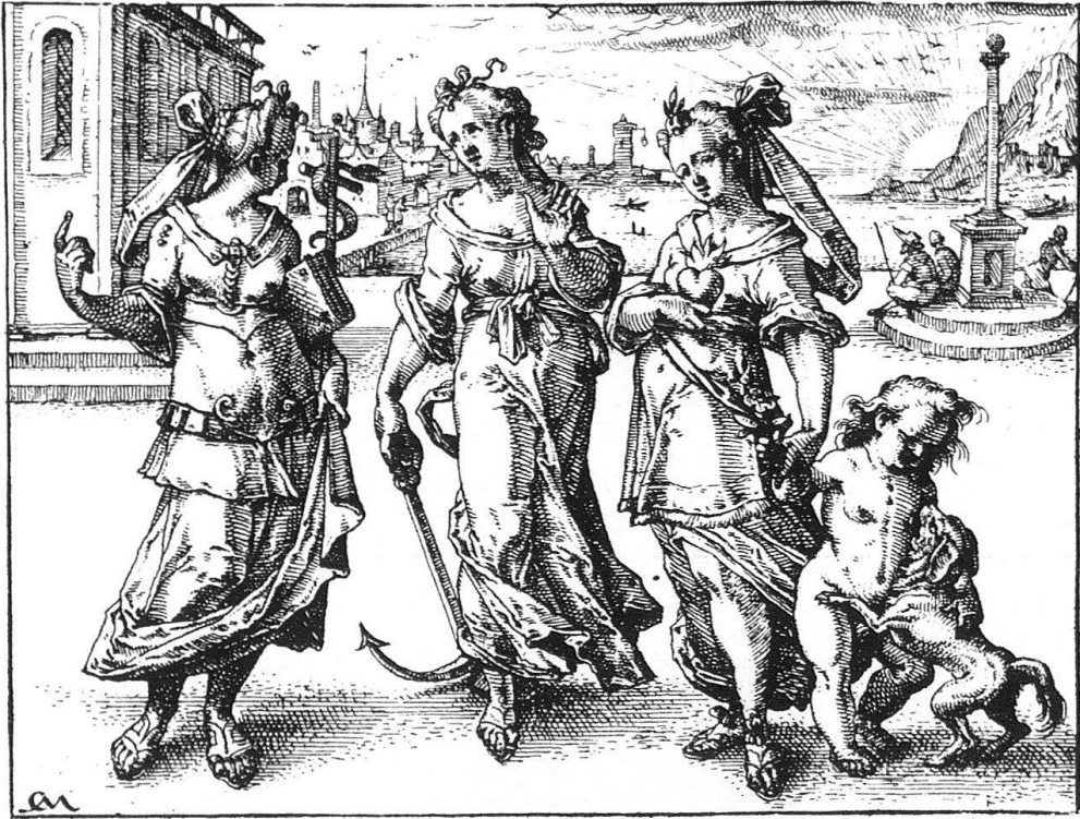
4 Christoph Murer, Fides, Spes, Caritas. Radierung, in: Emblemata, Zürich 1622.

für den Formschneider gedacht, der möglicherweise den Entwurf selbständig auf den Stock übertrug und ihn – auch er ist laviert – in das für den Holzschnitt nötige Liniengerüst umsetzte.