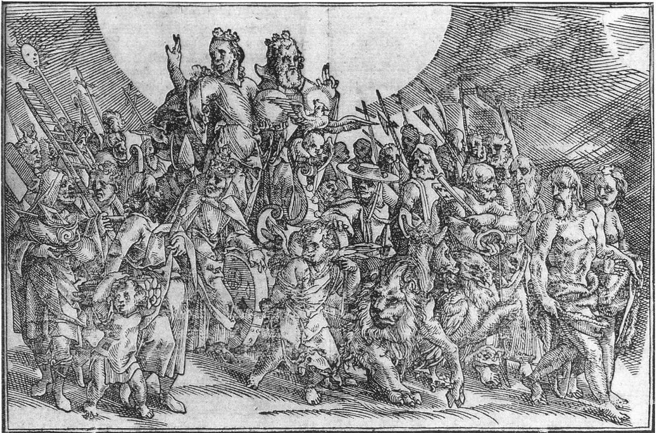
1 Christoph Murer, Triumph der Ewigkeit. 1578. Holzschnitt, in: F. Petrarca, Trionfi , Basel 1578.

und als Dichter hervorgetreten. Nach seiner Beteiligung am Standescheibenzyklus für das Kloster Wettingen ist er um 1578/79 nach Basel gezogen, wo er für Leonhard Thurneysser einen Scheibenzyklus entwarf, der das Leben dieses weitgereisten, abenteuerlichen Goldschmiedes, Alchemisten, Astrologen und kurfürstlich Brandenburgischen Leibarztes verherrlichte 4 . Später wanderte er weiter nach Strassburg, wo er mit Tobias Stimmer zusammenarbeitete, der zu seinem künstlerischen Vorbild wurde. 1586 kehrte er nach Zürich zurück. Als Vertreter seiner Zunft wurde er 1600 in den Grossen Rat gewählt und 1611 zum Amtmann von Winterthur bestellt.