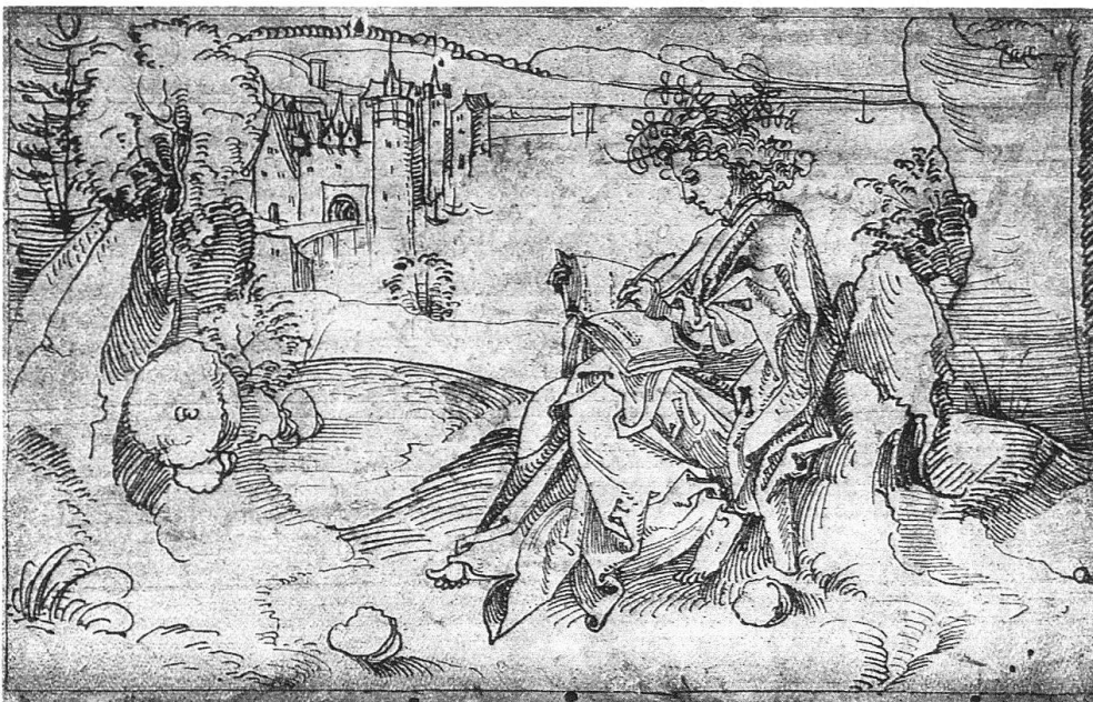
5 Albrecht Dürer, Der schreibende Terenz. 1492/93. Feder, auf ungeschnittenem Holzstock. Basel, Kupferstichkabinett