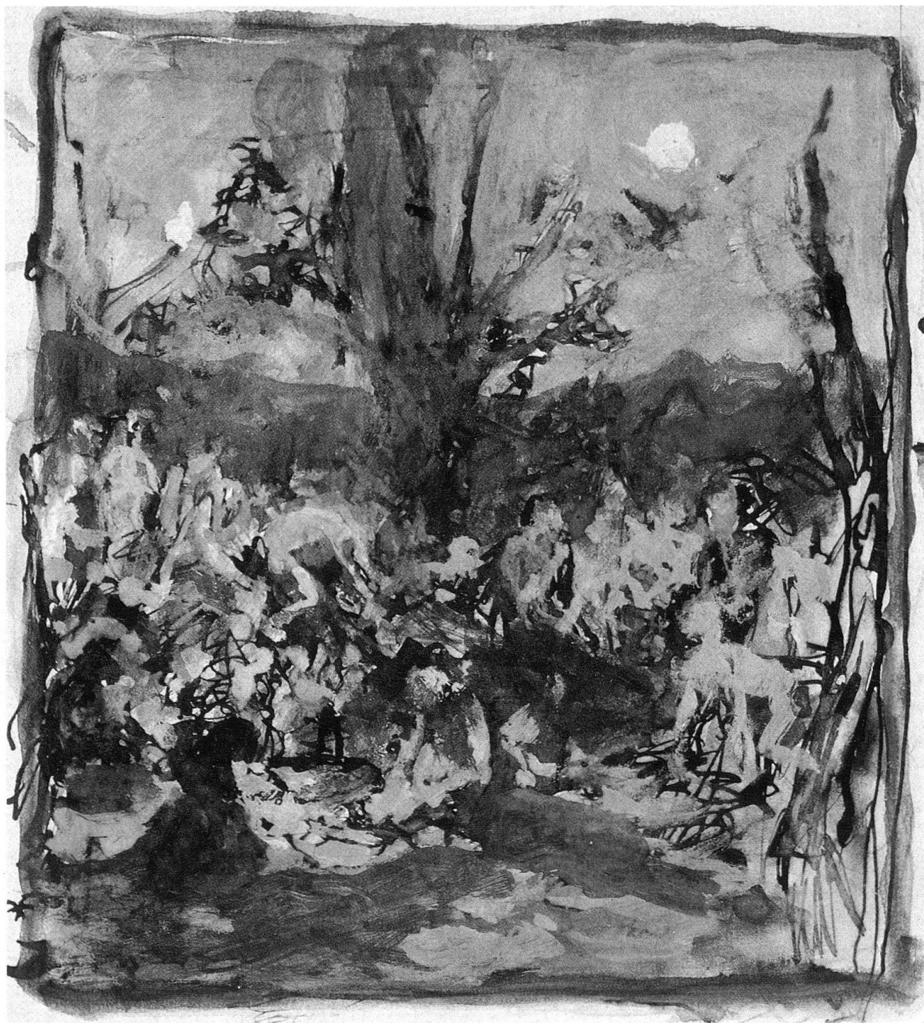
7 Sabba, dopo il 1900. Acquarello e inchiostro su carta, 20×18 cm, non firmato.

una maniera che richiama le incisioni di Welti dove si assemblano piccole, caotiche scene surreali e grottesche, Franzoni affolla le sue ultime suggestive visioni di orrende creature, scomponendo anche lui l'immagine in tante turbinose scenette.