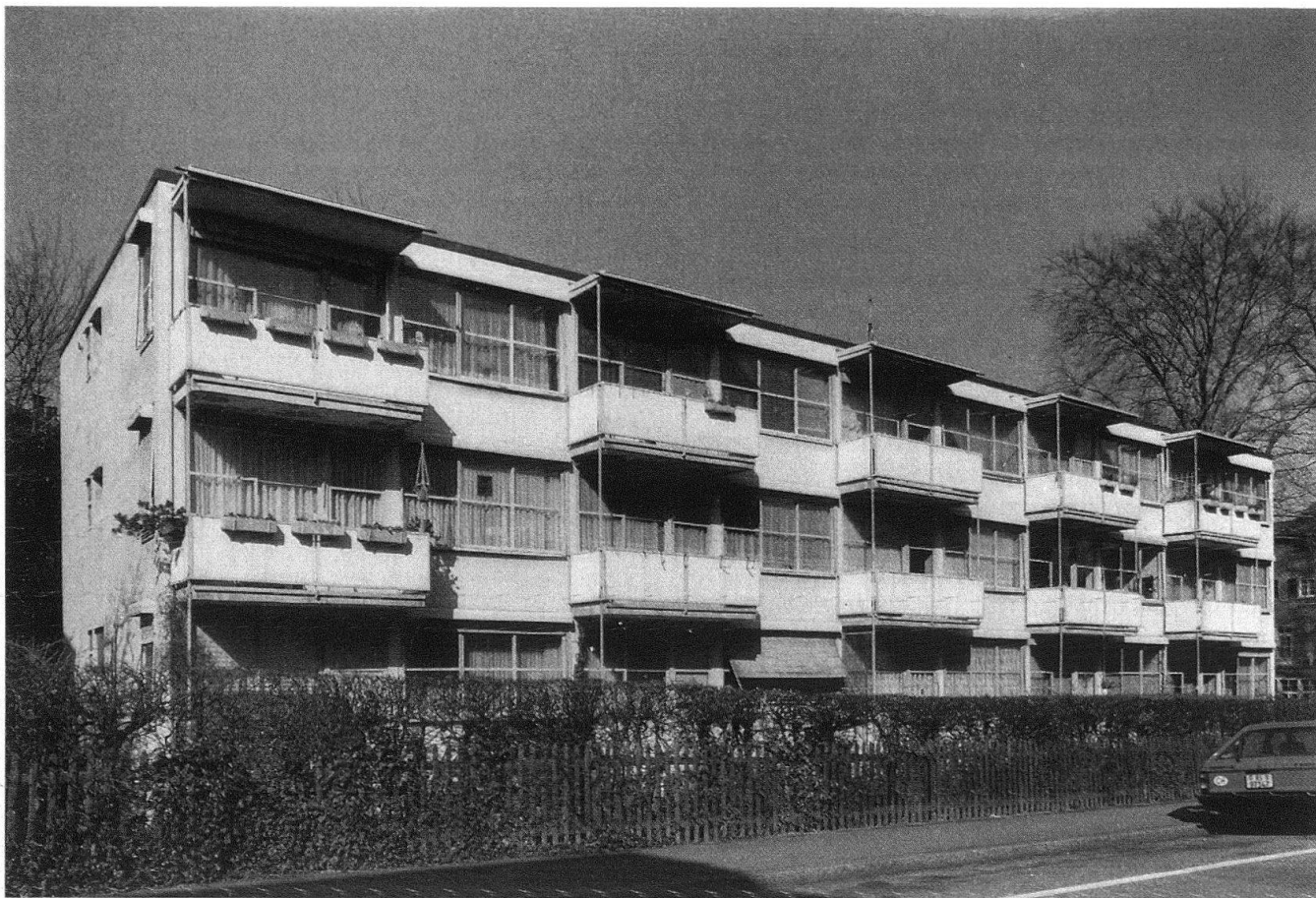
Basel, Haus für alleinstehende Mütter, Speiserstrasse 98, Architekten H. Schmidt und Paul Artaria, 1928–29.

ihr gesellschaftliches Engagement in die Tat umzusetzen mit einem Bau, der neben 22 Kleinwohnungen ein vielfältiges Angebot an Gemeinschaftseinrichtungen umfasste. Auch in konstruktiver Hinsicht ist das Haus bemerkenswert, indem hier – zur Verkürzung der Bauzeit und damit zur Senkung der Baukosten – die damals viel diskutierte Montagebauweise mit Eisenskelett und Bimsbetonausfachung zur Anwendung kam. Besondere Beachtung verdient die Strassenfassade, ein Meisterwerk architektonischer Gestaltung. Nachdem nun die schwarzen Eisenrahmenfenster, auf denen das feingliedrige, komplexe Ordnungsgefüge aufbaute, durch weisse Kunststoffenster billigster Sorte ersetzt wurden, wird niemand mehr den einmaligen Wert dieses Baus erkennen können. Auf diese Weise wurde Hans Schmidt