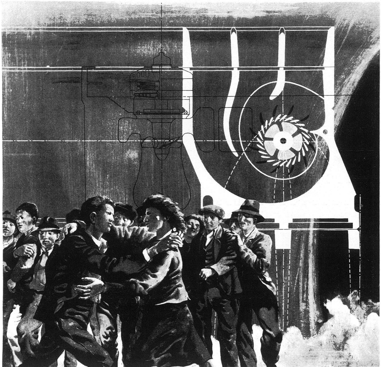
Hans Erni: ELEKTRIZITÄT

I. Jahrgang — Nr. 4 Mai 1945 — Preis Fr. 1.20