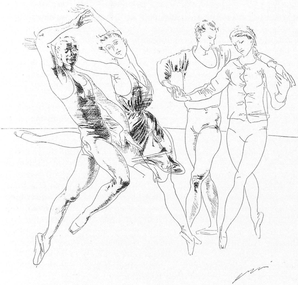
10 Hans Erni, L'une des sept gravures au diamant pour Galina Oulanova, «Ballets soviétiques», Lausanne, Suisse-URSS, 1955. Outre plusieurs huiles et temperas sur ce thème en 1954-1955, Erni l'introduit dans sa fresque du Musée d'ethnographie de Neuchâtel 1955.

«narodnost'» (impliquant un ancrage national et populaire), ou encore «humanisme» (toujours revendiqué comme sa motivation première), pour ne pas parler de l'«optimisme» ou de l'indispensable «positivité». On pourrait évaluer de même les critères de réalisation artistique («unité de la forme et du contenu», «maîtrise», «typicité») ou les justificatifs esthétiques («beau», «innovation»), n'étaient-ce l'indétermination fondamentale de toutes ces notions et leurs constantes fluctuations de sens à l'intérieur du système 35 .