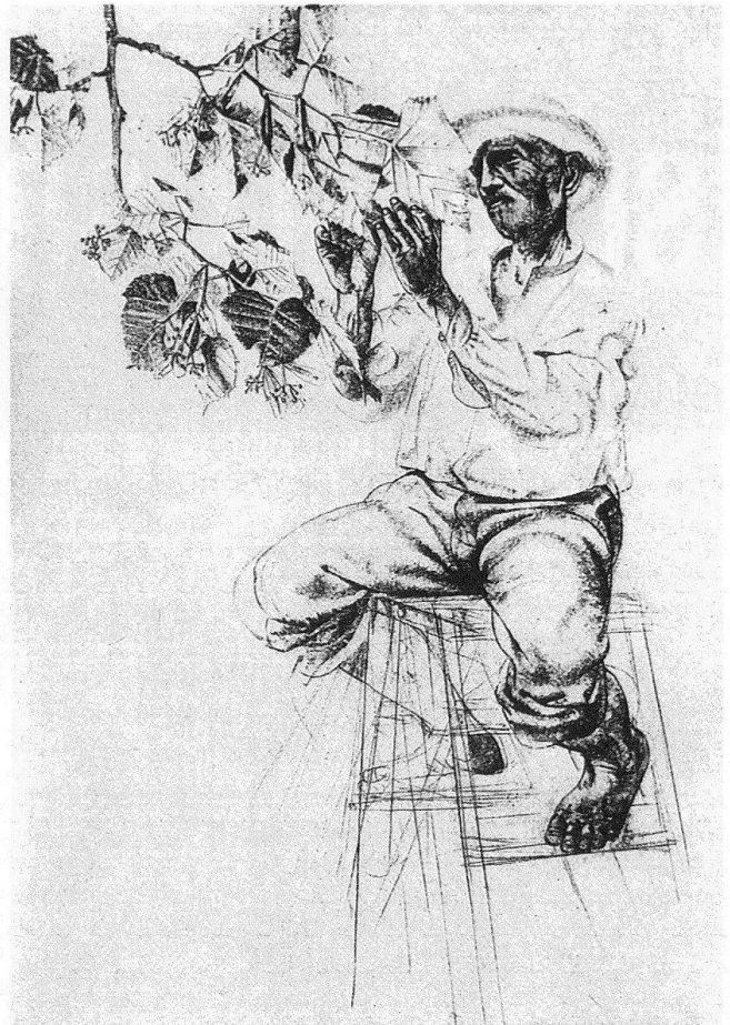
4 Hans Erni, Le grand jardinier Mitchourine , 1944, sanguine, 300×250 cm, reproduit dans «Suisse-URSS», 1945, N° 6, p. 16. En 1949-1950, sa reproduction servira de support visuel à la campagne lyssenkiste à Paris.