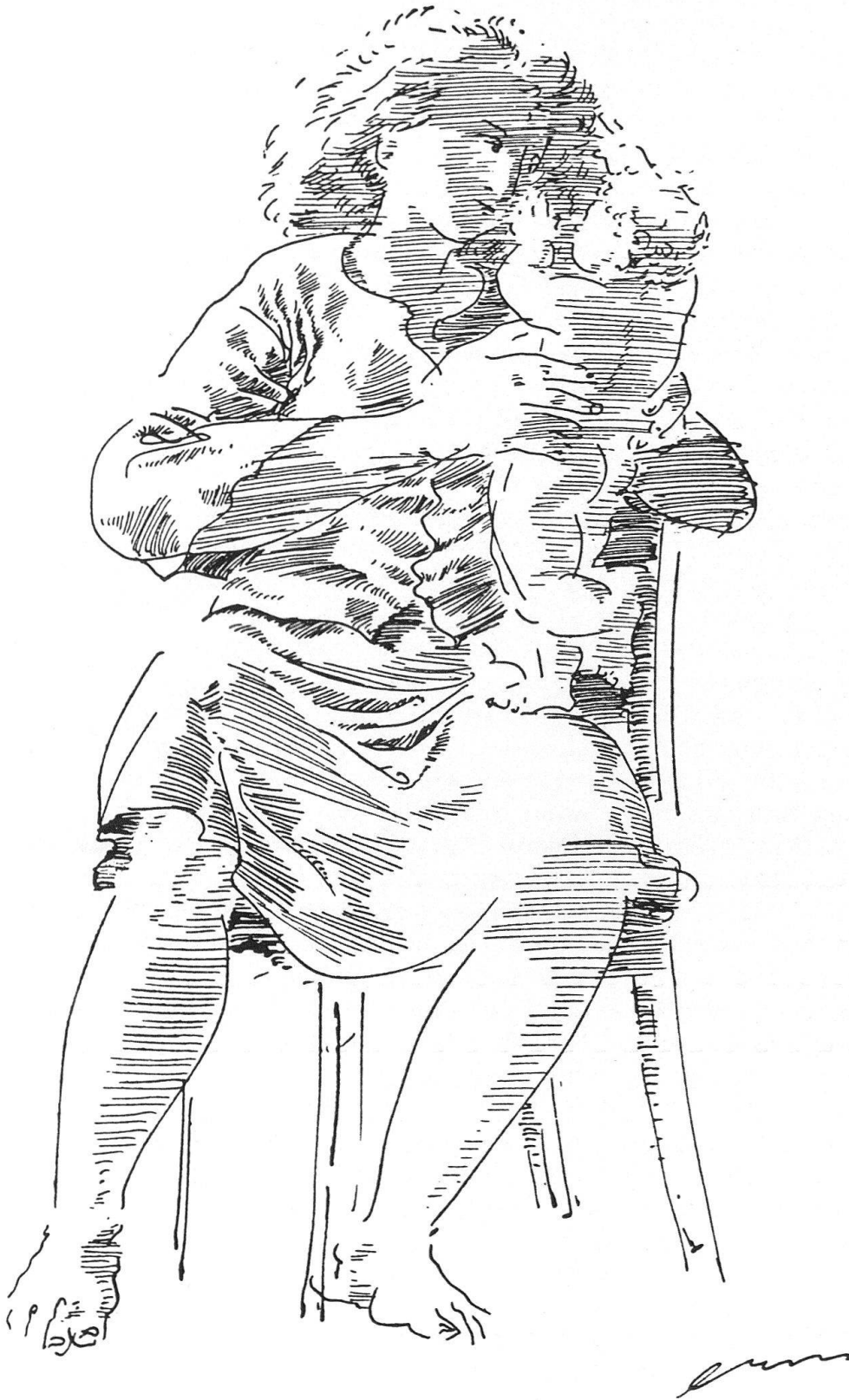
1 Hans Erni, page de la revue «Socialisme», N° 54, octobre 1949, p.33. L'une des multiples contributions graphiques non recensées à la presse du Parti Suisse du Travail.

l'Etat stalinien, dont il est l'émanation. Il connaîtra son expansion géopolitique maximale (Europe de l'Est, Chine) et l'apogée de ses effets normatifs durant la période dite du «jdanovisme» (1947-1953), pour entrer dès 1956 dans une phase de dépérissement 7 . L'«art de parti» qu'instituent les grands appareils communistes occidentaux à l'enseigne du jdanovisme et de la guerre froide sera baptisé «nouveau réalisme», entre autres par souci de ne pas usurper une déno-