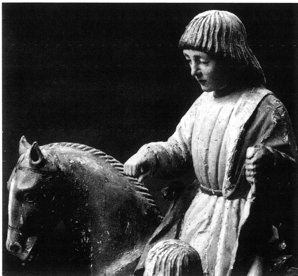
6 Il san Michele di Berlino.