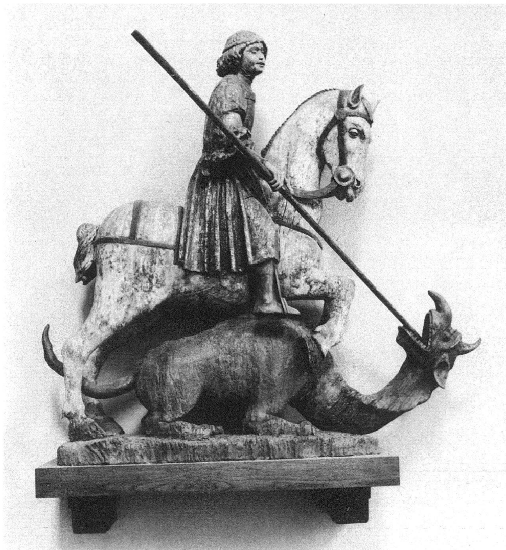
1 San Giorgio e il drago: visione d'insieme.

interessante motivo decorativo «a scudo», dove i bordi laterali vengono a costituire il profilo dell'attaccatura delle maniche. La veste termina con una serie regolare di pieghe piuttosto rigide e fra loro perfettamente cadenzate, che si differenziano dalla morbidezza di modellato delle maniche. Il santo indossa dei semplici stivali, leggermente a punta, di colore grigio.