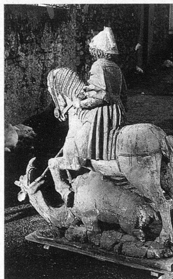
5 San Giorgio e il drago: la statua prima del restauro.