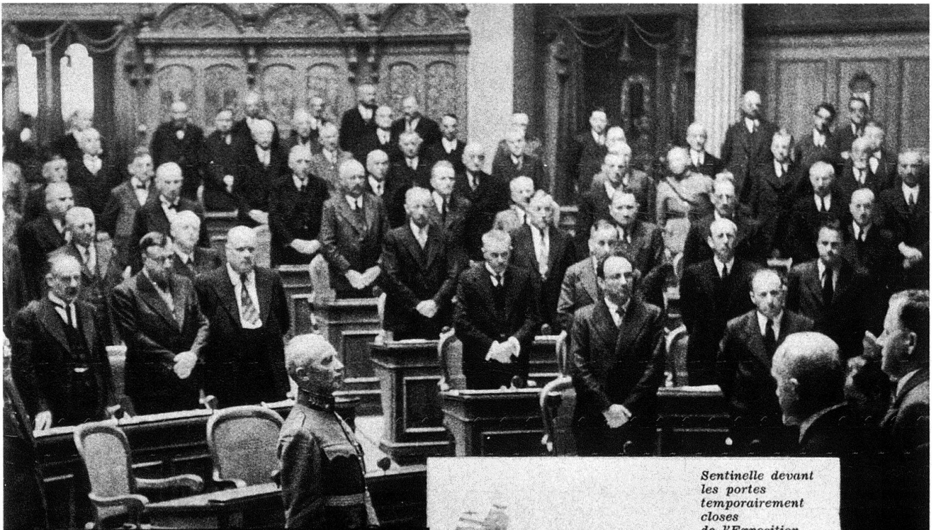
L'assermentation du Général devant l'Assemblée Nationale.