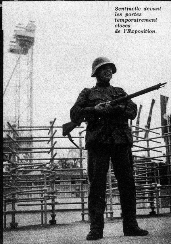
Sentinelle devant les portes temporairement closes de l'Exposition.

Jamais le peuple suisse ne fut plus uni!