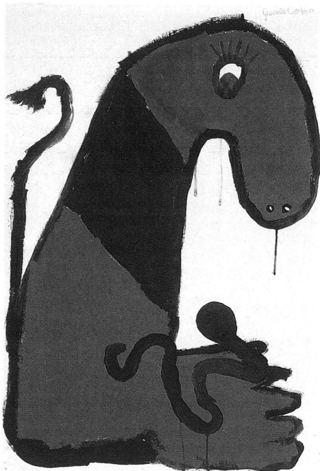
Monster von Christina Canessa, Zürich