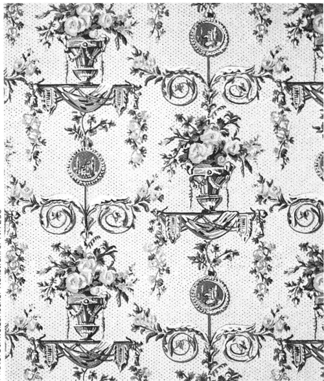
Papiertapete von 1785 aus Paris, Am-Rhyn-Haus Luzern

Die beiden Tage haben uns mit zwei Spezialgebieten vertraut gemacht, die wir zwar nicht täglich in unserer Arbeit brauchen, deren Bedeutung uns aber doch bewusst sein muss, wenn wir auf alte Tapeten und bedruckte Stoffe stossen. Wir sind in der kurzen Zeit keine Spezialisten geworden, wissen nun aber Grundlegendes über diese Themen. Und vor allem sind Fäden geknüpft worden, die wir wieder aufnehmen können.