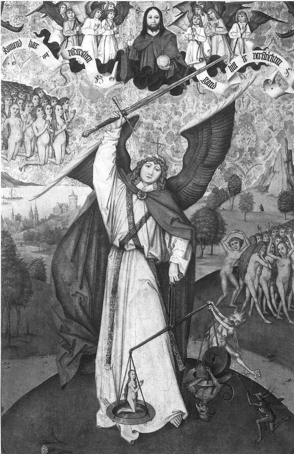
9 Zürcher Nelkenmeister, Jüngstes Gericht, Erzengel Michael als Seelenwäger.

Seelenwägungsbildern, dass es sich bei der Geretteten um eine Frau handelt 18 . Möglicherweise gibt dies einen Hinweis darauf, dass mit einer weiblichen Auftraggeberschaft zu rechnen ist 19 . Die Stimmung des Bildes ist verhalten. Die Reue der Verdammten in ihren rückwärtsgewandten Blicken zum Ausdruck zu bringen war wichtiger, als mit drastischen Bildmotiven die Qualen der Hölle zu schildern. Die Auftraggeberschaft wollte offenbar nicht mit emotionsgeladener Drastik, sondern mit subtileren Mitteln belehren – dies vielleicht