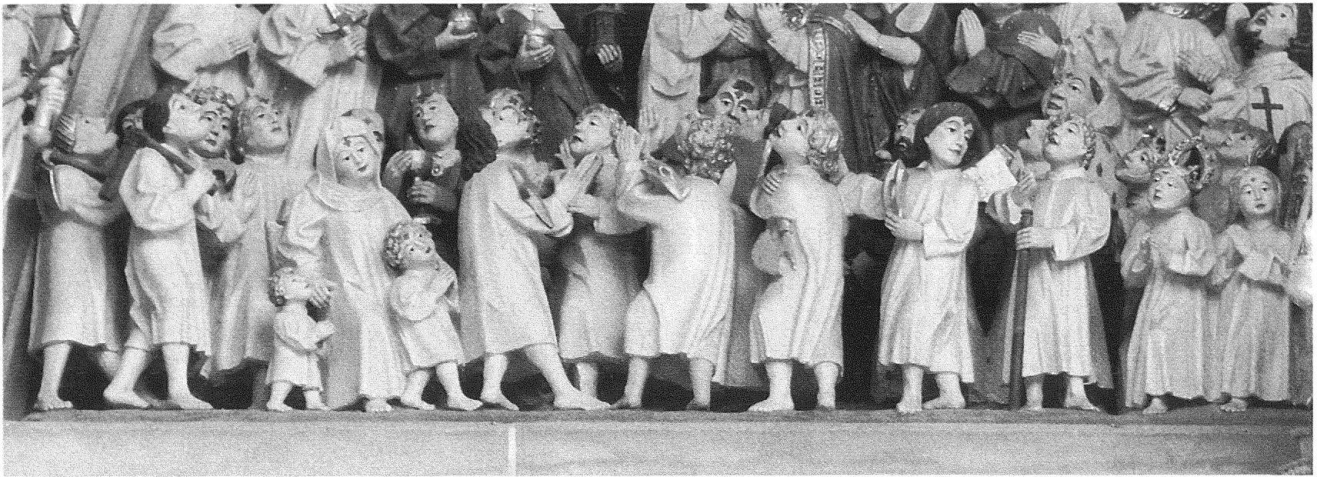
2 Tympanon des Berner Münsterportales, Detail: Die vorderste Reihe der Seligen.