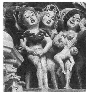
1 Tympanon des Berner Münsterportales, Detail von der Seite der Verdammten: Eine Hure und eine Kindstöterin.

Aus einem spezifischen und deshalb bewusst eingeschränkten Blickwinkel soll hier versucht werden, so betont belehrende Kunstwerke wie Weltgerichtsdarstellungen zu betrachten im Hinblick auf die Bilder von Frauen und von Weiblichkeit, die sie entwerfen und verbreiten. Da es, auch für die spätgotische Zeit, nahezu keine Literatur zum Thema «Bild der Frau» gibt, ist sowohl ein Überblick als auch die Bewertung der Einzelfälle an dieser Stelle kaum möglich. Ich kann deshalb nur anhand dreier konkreter Beispiele, des Berner Münsterportales, der Rückseite des Flügelaltares von Stürvis und einer Tafel des Michaelaltares des Zürcher Nelkenmeisters, Beobachtungen und Fragen skizzieren, deren Mass an Allgemeingültigkeit in einer breiteren und differenzierteren Untersuchung beurteilt werden müsste.