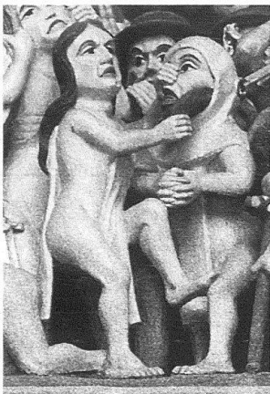
3 Tympanon des Berner Münsterportales, Detail von der Seite der Verdammten: Eine unkeusche Nonne und ein Mönch.