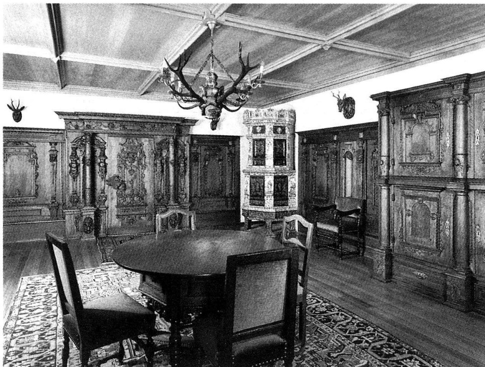
2 Kriegstetten, Schloss Landshut. Das zurückgeführte Getäfel. Zustand 1980.

herrschen, so berührt sie doch auch die Sammlungspolitik der Museen und gelegentlich ihre alten und ältesten Bestände.