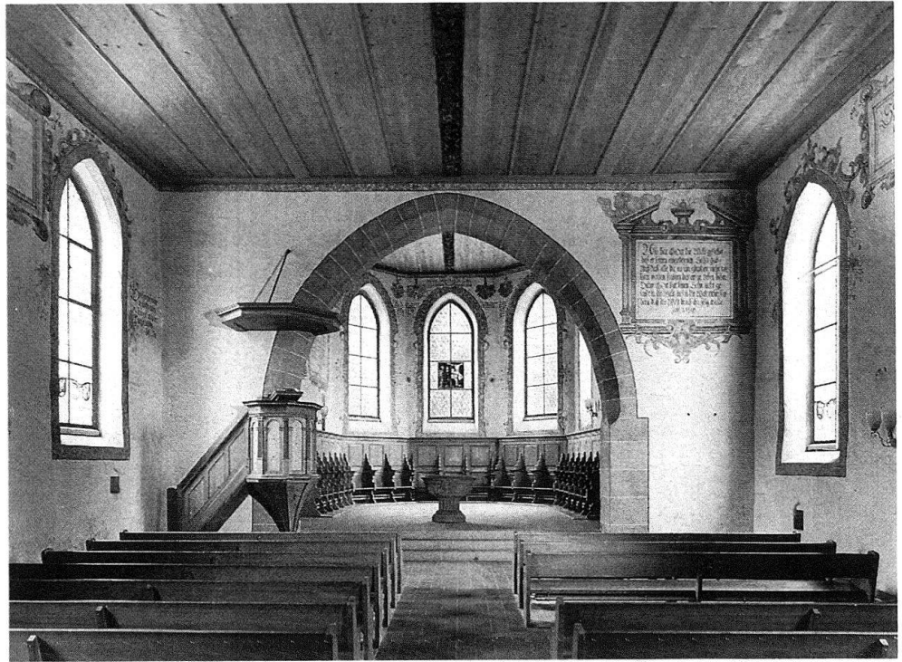
3 Biglen, reformierte Kirche, Inneres nach Rückführung der Flach-schnitzereidecke. Zustand 1981.

schlagen und von dieser 1889 in das Stiftungsgut des Bernischen Historischen Museum eingebracht. Aber nicht erst seit dessen Eröffnung im Jahre 1894, sondern schon zuvor wurden die Bildteppiche aus Lausanne gezeigt, zuerst vor allem als Festschmuck bei Abschluss von Staatsverträgen, bei Bundeserneuerungen und bei Tagatzungen, später als Schaustücke am Sitz der Stadtverwaltung im Erlacherhof, in der Stadtbibliothek und im alten historischen Museum neben der Bibliothek.