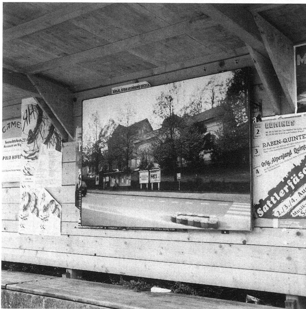
4 Giro Annen, Fotografie, 1991, Installation in der Ausstellung «Chamer Räume», Cham 1991.

den, auf dem Gelände des barocken Schlossparks am Genfersee Orte für ihre Installationen auszusuchen. Schon der Ausstellungstitel «Promenades» betonte den Gegensatz zum städtischen Flanieren. Die Konzeption griff auf Formen der Bespielung barocker Gärten, etwa des Aueparks seit der documenta 7, zurück. Aber in Genf durften die Besucher eigene Pfade finden, um die einzelnen Arbeiten zu betrachten und miteinander auf unterschiedliche Weise in Beziehung zu setzen. Die Umgebung, die Aussicht, die Topographie, die Gerüche, die Temperatur wurden dabei als eigene Parameter erlebt, die die Werke jeweils vor anderen Rahmen sehen liessen. Eine weitere Ausstellung, «Repères», umfasste 1986 sogar 58 Künstler in sieben Walliser Gemeinden 24 . In Bex, ebenfalls weit abseits der Kunstzentren, wurden 1990 eine Reihe von Schweizer Künstlern aufgefordert, in der Ausstellung «Le dormeur du val – Sculpture suisse contemporaine» 25 mit ihren Installationen an einer «Zelebration der Natur» 26 teilzunehmen. Weitere bedeutende Ausstellungen waren 1991 die Genfer «Climats» und die «Chamer Räume» in Cham.