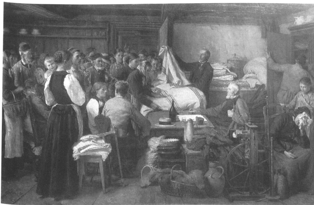
4 Albert Anker, Der Geltstag , 1891, Öl auf Leinwand, 89,5×140,5 cm. Privatbesitz. – Anregung gewann Anker von einem Gemälde des Neuenburger Malers Edouard Girardet «Die Versteigerung» von 1840. Musste die Dramatik des Geschehens durch den kompositorischen Gestaltungsvorgang auch Milderung in Kauf nehmen, bleibt die bewusste Gegenüberstellung von Macht und Ohnmacht deutlich erkennbar.

Nur vereinzelt spielen sich Szenen in einem bürgerlichen Ambiente ab 16 . Bildung sollte nicht den Schichten des Wohlstands und des Bürgertums vorenthalten bleiben. Als Mitglied der Inser Schulkommission hat er aktiv an Schulanliegen und Unterrichtsreformen teilgenommen. Im Gemälde Das Schulexamen (Abb. 3) griff er ein Thema auf, das früher schon in der Dorfschule im Schwarzwald (1858) Bildgegenstand gewesen war. Der Betrachter wohnt der Bildungsvermittlung wie an einem Schauspiel bei, er wird bei Anker nie ins Geschehen involviert, Blickkontakte finden kaum je statt. Bühnenartig breitet sich der Prüfungsvorgang, der sich durch die Figurenanordnung und Lichtführung im Mittelpunkt bündelt und verdichtet, vor ihm