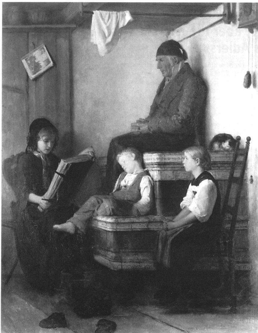
2 Albert Anker, Sonntag nachmittag , 1862, Öl auf Leinwand, 82×65 cm. Musée d'art et d'histoire, Neuchâtel. – Die Gegenüberstellung von Jung und Alt ist ein immer wiederkehrendes Thema Ankers. Das ländliche Elend wollte er nie darstellen, er mied alles Hefige, die grellen und lauten Töne.

aber von weiterreichender, über die Grenzen heimatlicher Enge hinaus weisender Gesinnung. Immer wieder findet man in seinen Briefen und Notizen Äusserungen, die ein aufgeschlossenes Interesse sowohl an der Historie und der Literatur wie auch an sozialen und politischen Fragen seiner Gegenwart verraten. Er war nie bestrebt, nach «Lösungen» zu suchen; sein erklärtes Hauptziel war «die respektvolle Demut» vor den Mysterien 7 .