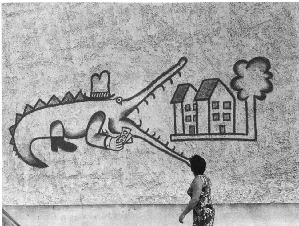
6 Wandmalerei gegen die Bauspekulation und die Zerstörung des Quartiers, Biel 1975.

In der schweizerischen Gesellschaft sind disparat erscheinende Veränderungen festzustellen, die teils an recht grundlegende Aspekte unserer Gesellschaft rühren. Die meisten dieser Tendenzen scheinen ein Auseinanderdriften von institutionellen Strukturen und persönlich erfahrener und gestalteter Alltagswelt auszudrücken. Es ist, als ob sich an der Schnittstelle zwischen dem gesamtgesellschaftlichen Rahmen, der das tägliche Leben organisiert, und den individuellen Verhaltens-