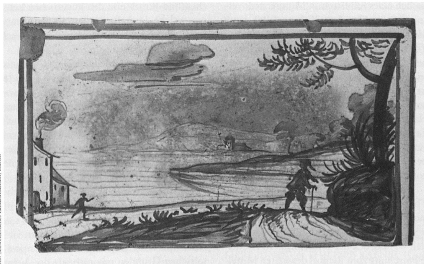
Caspar Wolf, blau bemalte Ofenkachel (hohl) mit Wanderer in der Landschaft, Muri, um 1772.

Stattliche Öfen mit Reliefkacheln von teilweise grossem Format wurden im Freiamt aber auch schon vor Caspar Wolf hergestellt. Dank der regen Bautätigkeit des Klosters Muri entstanden dort kunstvolle Hafnerarbeiten, die auch über die Region hinaus ihren Absatz fanden. Inwiefern dies auch für Zug galt, ist eine Frage, die an dieser Ausstellung über die Ofenkeramik aus Muri und Zug im 17. und 18. Jahrhundert erstmals gestellt wird. Die Schau zeigt das Kapitel Freiamt aus der Ausstellung «Aargauische Ofenkeramik des 17. und 18. Jahrhunderts» des Schweizerischen Landesmuseums, die im Schloss Wildegg und danach im Museum Bäregasse in Zürich zu sehen war; sie wird ergänzt durch bemalte Ofenkacheln aus Beständen des Museums in der Burg Zug. Museum in der Burg Zug / CF