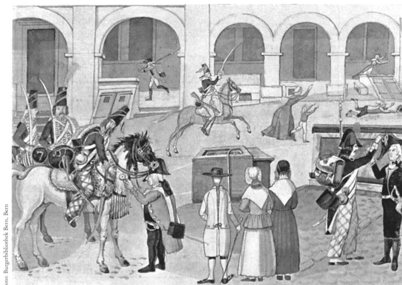
Karl Howald (1796–1869), Berner Brunnenchronik : Die Plünderungen nach dem Einfall der Franzosen am 5. März 1798

Im zweiten Teil wird ein Besuch im Restaurierungsatelier stattfinden, das die Burgerbibliothek gemeinsam mit ihrem Hausnachbarn, der Stadt- und Universitätsbibliothek Bern, besitzt und das eine der führenden Werkstätten auf diesem Gebiet darstellt. Dabei soll ein Einblick in die Methoden ermöglicht werden, mit denen man heute die gefährdeten Kulturgüter aus Pergament und Papier zu konservieren versucht, wobei man verantwortungsbewusst arbeitet und sich modernster Techniken bedient.