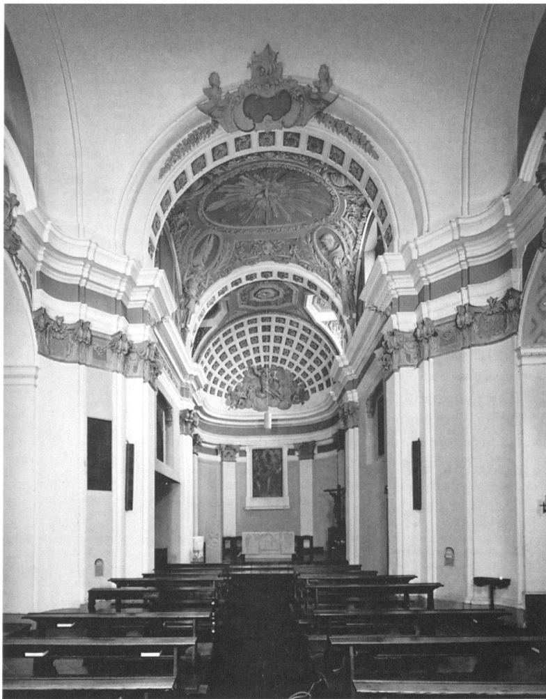
17 Porza, Chiesa dei Santi Bernardino e Martino, stucchi della volta del coro e del presbiterio, Gerolamo Soldati, 1785-90. – I motivi figurativi e decorativi sono trattati secondo i dettami neoclassici.

che sembrano desunti dalla statuaria antica – si osservi il volto di Santa Monica – si alternano tratti somatici più popolari e realistici – Sant'Agostino con la lunga barba e un San Carlo più assorto –. Gli incarnati risultano estremamente levigati quasi da apparire ricavati dal marmo, e non da ultimo una sottile vena sensuale traspare dai putti reggicorona del frontone, che aiutano a sciogliere quella prima impressione di freddo accademismo tipico di tanta scultura di fine Settecento 57 .