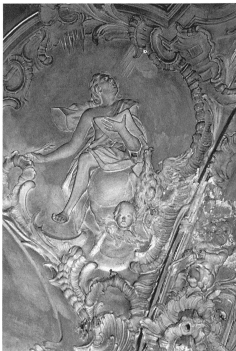
13 Castel San Pietro, Chiesa di Sant'Eusebio, particolare della volta del coro con San Luca Evangelista, Francesco Pozzi, 1756.