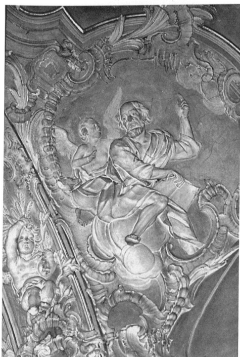
14 Castel San Pietro, Chiesa di Sant'Eusebio, particolare degli stucchi del catino absidale, Francesco Pozzi, 1756.

Il coro e il presbiterio della Parrocchiale di Castel San Pietro sono stati decorati dallo stuccatore Francesco Pozzi (1702-1784), nel corso del 1756. Per questa bella e ricca ornamentazione che una volta ancora conferma l'alta maestria raggiunta dall'artista di Castello 46 , desideriamo sottolineare un aspetto che riteniamo particolarmente interessante e che è stato sino ad ora trascurato dalla critica, ossia la stretta interdipendenza che sembra sussistere tra la presente opera plastica e le pitture circostanti eseguite da Carlo Innocenzo Carloni di Scaria nel corso dello stesso anno 47 . Nulla ci è dato di sapere sul tipo di rapporto sussistente tra il Pozzi e il Carloni, ma dall'osservazione dell'insieme decorativo possiamo notare come certe formule stilistico-formali risultino comuni tanto da far supporre che l'insieme sia stato concepito dai due artisti attraverso un progetto globale 48 . Innanzi tutto notiamo come piccoli motivi di tipo rocaille vanno ad invadere il campo pittorico interagendo con esso: alcune foglie lanceolate in stucco sembrano riprendere le alette dei putti dipinti; altre, sfrangiate, si frammistano a vaporose nuvole pittoriche. Nelle figure degli Evangelisti in bassorilievo, seminudi, avvolti in un drappeggio all'antica e adagiati su vaporose nuvole (ill. 12, 13, 14), possiamo pure riscontrare affinità stilistiche con alcuni personaggi del dipinto centrale: si veda in particolare lo stucco con l'Evangelista San Giovanni e l'immagine di