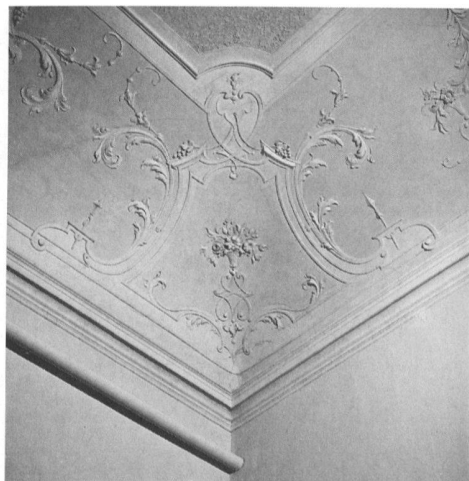
5 Lugano, Palazzo Riva di piazza Cioccaro, particolare del soffitto del salone al piano nobile, attribuito a Francesco Camuzzi, 1732 circa. – Questa delicata ornamentazione rispecchia lo stile reggenza.