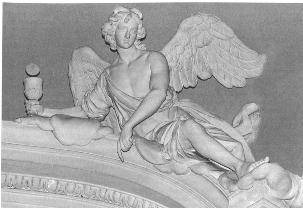
19 Morbio Superiore, Chiesa di San Giovanni Evangelista, angelo dell'altare maggiore, attribuito a Carlo Luca Pozzi, 1789-94.

barocchetto lombardo. Lo stile rocaille, rappresentato da due complessi ornamentali di eccellente qualità – le Parrocchiali di Capolago e di Castel San Pietro – si sviluppa nei primi anni della metà del Settecento e il suo declino si manifesta a partire dall'ottavo decennio del secolo, allorché timide avvisaglie segnalano il passaggio verso nuovi modi neoclassici, pienamente espressi nei decenni seguenti.