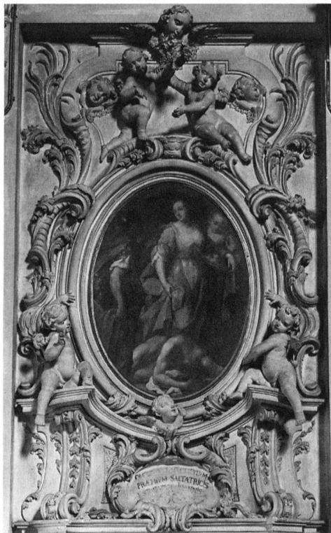
4 Mendrisio, Chiesa di San Giovanni, cornice a stucco, Antonio Catenazzi, 1724-25. - Il tipico linguaggio formale tardo-barocco è ancora presente nel terzo decennio del '700.

La presenza di Bartolomeo Rusca è stata di recente individuata pure in Palazzo Riva di piazza Cioccaro a Lugano, dove sulla volta di un ampio salone al primo piano è raffigurata «L'educazione del giovane», opera eseguita tra il 1730 e il 1732 20 . Nessuna notizia specifica possediamo invece al riguardo della decorazione a stucco 21 (ill. 5) che verosimilmente do-