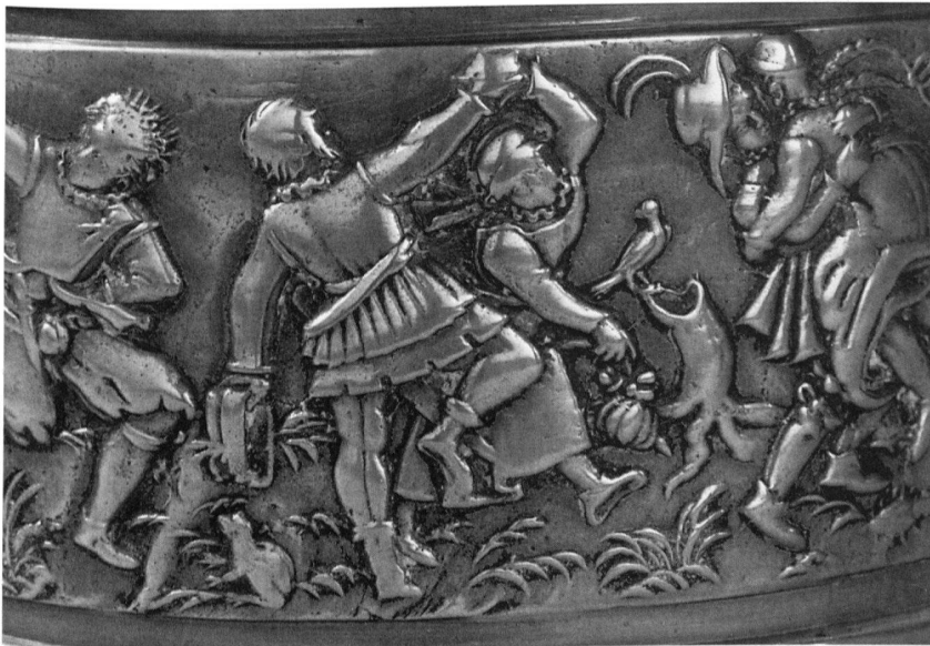
Dur labeur, joyeuses fêtes: la décontraction des paysans dans la danse. Bas-relief d'une soupière, XVI e , Forum de l'histoire suisse, Schwyz.

Musée national, jusqu'au changement de la direction en automne 1993.