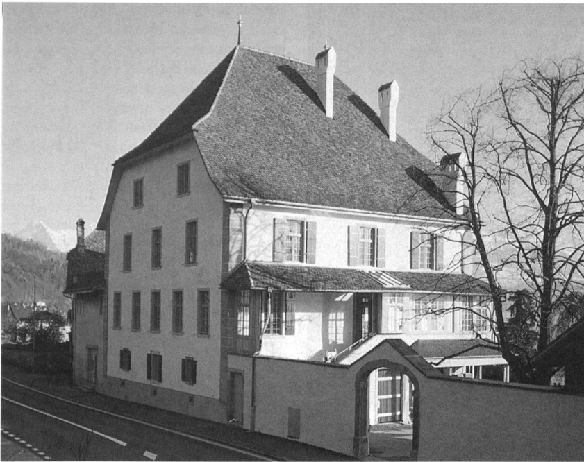
Das restaurierte Wichterheer-Gut am Thunersee in Oberhofen, das seit Mai dieses Jahres die Sammlung Im Obersteg und das Museum für Uhren und mechanische Musikinstrumente beherbergt.