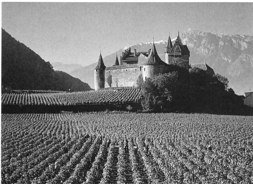
Schloss Aigle aus dem 15. Jahrhundert, welches das Musée vaudois de la vigne et du vin enthält.

tergründen von Kulturdenkmälern sowie mit den Problemen ihrer Erhaltung vertraut gemacht. Dieses Jahr konnten sämtliche Kantone gewonnen werden. Der attraktive inhaltliche Schwerpunkt – Schlösser, Burgen und historische Landsitze – lässt eine rege Beteiligung der Bevölkerung in allen Gebieten der Schweiz erwarten.