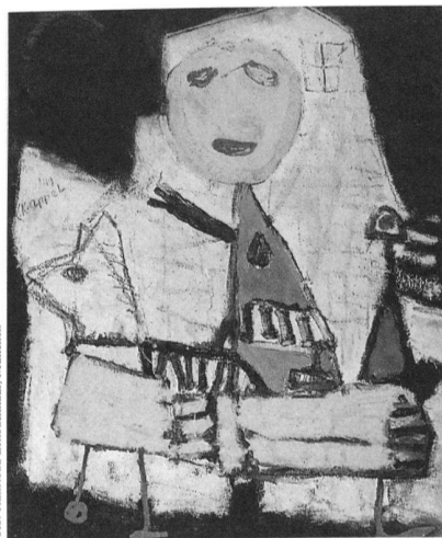
Karel Appel, Kind auf einem Spielzeugpferd, 1949, Öl auf Leinwand, 75×65 cm, Privatbesitz.

Die Bedeutung der sogenannten primitiven Kunst für das Schaffen der grossen Meister unseres Jahrhunderts gehört heute zum selbstverständlichen Wissen über moderne Kunst. Auch andere Aspekte einer erweiterten Auseinandersetzung der modernen