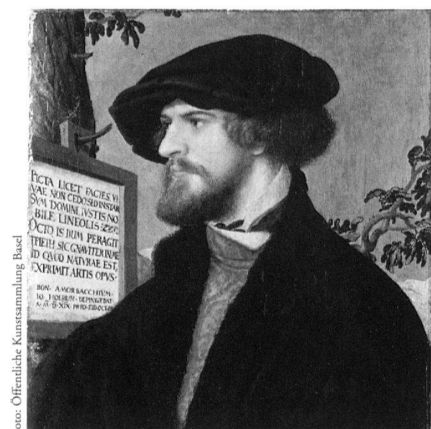
Hans Holbein d. J., Bildnis des Basler Rechtsgelehrten Bonifacius Amerbach, 1519, gefirniste Tempera auf Tannenholz, 28,5×27,5 cm, Öffentliche Kunstsammlung Basel.

Die Öffentliche Kunstsammlung Basel, wie das Kunstmuseum mit offiziellem Namen heisst, ist die Frucht eines sehr frühen kulturellen Engagements. Ihre Geschichte lässt sich bis zu einer der glanzvollsten Epochen der älteren Stadtgeschichte, der Blüte des Humanismus zu Beginn des 16. Jahrhunderts, zurückverfolgen. Damals entstand die Privatsammlung der Familie Amerbach,