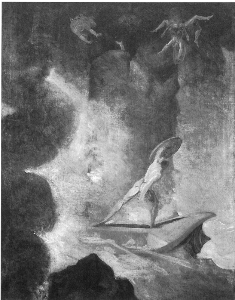
7 Johann Heinrich Füssli, Odysseus zwischen Skylla und Charybdis , 1794–1796, Öl auf Leinwand, 126×101 cm, Aargauer Kunsthaus, Aarau. – Indem Füssli den ganzen Körper seiner Figuren sprechen lässt, wirkt er zukunftsweisend.

chelt werden – dies müsse jedoch oberstes Ziel eines jeden Künstlers sein. Das Pathos eines Augenblicks wird für Füssli in der Aktion einer Figur, im Bewegungsmoment des ganzen Körpers, Erlebnis. So vermeidet der Maler die Lieblingsmotive des Klassizismus, Sterbebett und Trauerzug, bei denen der Gesichtsausdruck der Figuren im Vordergrund steht. Seine Helden müssen sich im Kampf bewehren – Odysseus zwischen Skylla und Charybdis, Satan in der Auseinandersetzung mit der göttlichen Gewalt. Die Ungewissheit des Ausgangs der dargestellten Handlungen kann beim Rezipienten zu Schauern des Erhabenen führen. In dieser Wirkabsicht liegt der Grund für die expressive Qualität vieler Werke Füsslis. Er schreckt im Ausdrucksbereich vor keinem Extrem zurück, ohne sich auf der formalen und inhaltlichen Ebene immer festzulegen. Vieles bleibt bewusst undeutlich, obskur – damit ist er zukunftsweisend. So lässt sich abschliessend auch vom Theoretiker Füssli sagen, dass er weder die orthodoxe klassizistische noch die reine romantische Lehre vertritt. Will man eine klare Grenzlinie zwischen den beiden Lagern ziehen, was in vielen Fällen nicht leicht ist, wird man Füssli nie im Zwischenbereich