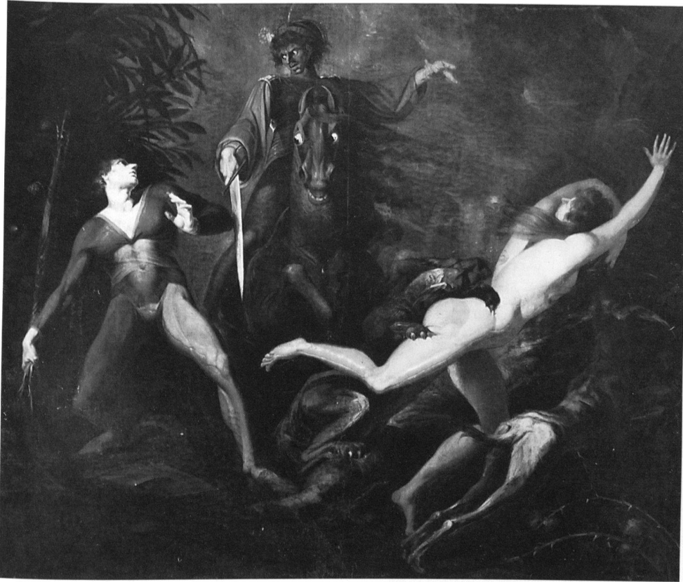
2 Johann Heinrich Füssli, Theodor begegnet im Wald der Erscheinung seines Ahns Guido Cavalcanti, der seine einstige spröde Geliebte Honoria mit Hunden betzt, 1783–1784, Öl auf Leinwand, 276×317 cm, The National Museum of Western Art, Tokyo. – Dieses Bild, das Füssli nach einer Vorlage aus Boccaccios Decamerone für den exzentrischen Lord Orford, den Neffen Horce Walpoles, malte, kann als ein Beitrag des Künstlers zum Gothic Revival betrachtet werden.

hatte sich die Kunstgeschichte gerade als Stilgeschichte an den Hochschulen etabliert. Das lange Leben Füsslis umspannt einen Zeitraum, während dem der Niedergang des Rokos und der Aufstieg des Klassizismus zu beobachten ist, seinerseits abgelöst von der Romantik – so jedenfalls sahen und sehen es die kunsthistorischen Handbücher. Das Werk des Malers aus Zürich, der an der Londoner Akademie die Stellung des Professors und Institutsleiters (Keeper) innehatte, will sich nicht in diese Stilabfolge und schon gar nicht in eine einzelne Phase einfügen lassen. Seine Handschrift wird allgemein, ohne dass man sie genauer beschrieben hätte, als eigentümlich erkannt 4 . Gerade deshalb ist die Füssli-Forschung bis in die sechziger Jahre unseres Jahrhunderts hauptsächlich damit beschäftigt, die Ursprünge seines Stils zu erforschen und ihn ins Stilpanorama des ausgehenden 18. und beginnenden 19. Jahrhunderts einzuordnen.