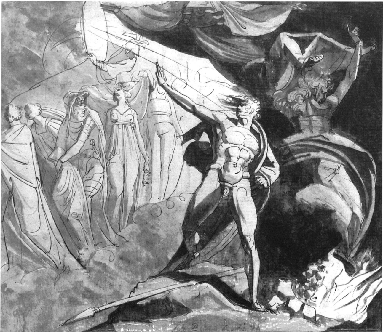
5 Johann Heinrich Füssli, Die Hexen zeigen Macbeth Banquos Nachkommen , 1773–1779, Feder und Tusche, 36×42 cm, Kunsthaus Zürich. – Weniger die einzelnen Figuren, wohl aber die unklare Raumstruktur bei gleichzeitigem heftigen Tiefenzug können als unklassizistische Gestaltungselemente angesehen werden.

gleichzeitig eine andere, geschmeidigere Übersetzung dieser Schrift auf dem Londoner Markt auftauchte, blieb dieses Unterfangen erfolglos. Dennoch beschäftigte sich Füssli in den darauffolgenden Jahren intensiv mit der englischen Herausgabe von Winckelmanns Hauptwerk Geschichte der Kunst des Altertums . Der Künstler kam damit nicht zu einem Ende; aber Winckelmanns Ideen waren ihm, als er 1769 zu seiner Romreise aufbrach, bis in die Einzelheiten geläufig. Dass er sich auch in dieser frühen Phase nicht sklavisch an das Vorbild hielt, zeigen die vielen Freiheiten, die er sich als Übersetzer herausnahm. Hingegen lässt sich kaum bestreiten, dass er in seinen späteren Akademievorlesungen die ästhetischen Leitbegriffe, weniger die Gedanken im einzelnen, von Winckelmann, Mengs und Reynolds übernommen hat.