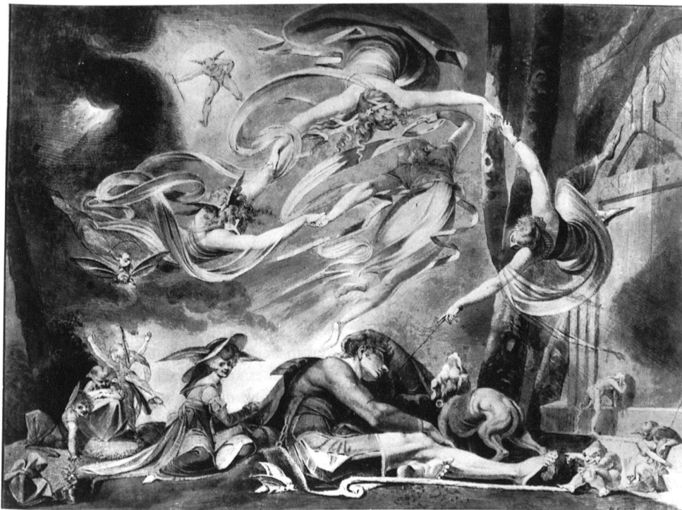
4 Johann Heinrich Füssli, The Shepherd's Dream (Milton, Paradise Lost ), 1786, Bleistift und Rötel, 40×55,2 cm, Albertina Wien. – Die reizenden Feengestalten, die mutwillig einen erschöpften Wanderer berücken, entstammen dem Volksglauben. Sie tauchen in England und Deutschland als keineswegs nur harmlose Figuren in der romantischen Literatur wieder auf.

Die isolierte Analyse seines theoretischen Schaffens ist ein Mittel, Füssli als latenten Klassizisten zu überführen und ihn gleichzeitig als einen konservativen Geist zu brandmarken 18 . Auf diesem Gebiet spricht tatsächlich einiges dafür, dass er den Lehren Winckelmanns und Mengs treu geblieben ist, obgleich er in späteren Jahren besonders den deutschen Altertumsforscher heftig angriff. Als junger Emigrant sollte Füssli in den 1760er Jahren mit seiner publizistischen Tätigkeit eine Brücke zwischen London und Zürich, dem englischen und dem deutschen Sprach- und Geistesraum schaffen. So sah es sein Lehrer und Mentor Johann Jacob Bodmer; selbst kein strenger Klassizist, sondern dem Sturm und Drang nahestehend. Da Winckelmann schon früh mit den gelehrten Kreisen in Zürich gute Kontakte unterhielt 19 , konnte Füssli zusätzlich als sein Sprachrohr in England dienen 20 . Die erste wichtige Veröffentlichung Füsslis in London galt tatsächlich Winckelmann. 1765 erschien Füsslis Übersetzung der Gedanken über die Nachahmung der griechischen Werke in Malerei und Bildhauerkunst zusammen mit kleineren Aufsätzen des selben Autors. Da