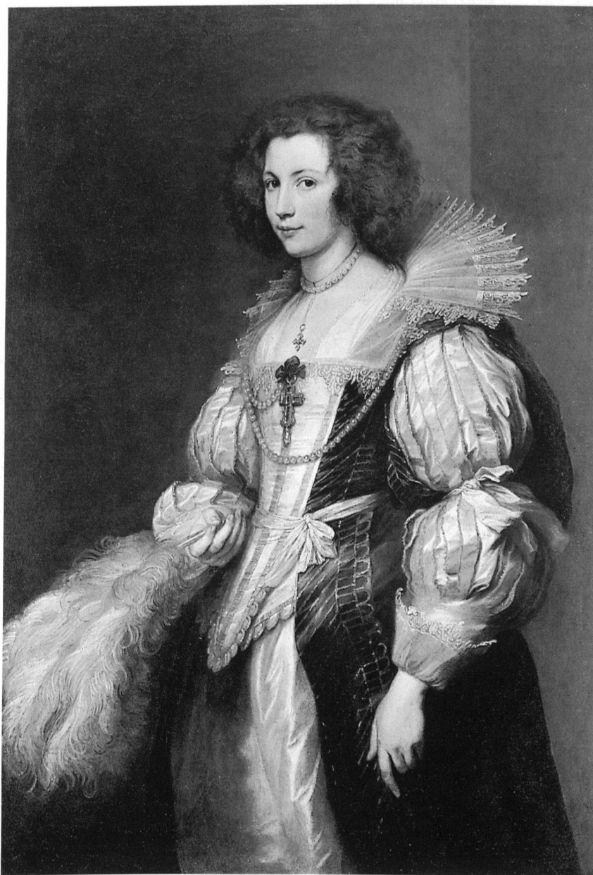
Anthonis van Dyck, Porträt der Maria Louise de Tassis , ca. 1630, Öl auf Leinwand, 129,0×92,8 cm, Sammlungen des Fürsten von Liechtenstein, Vaduz.

Staatliche Kunstsammlung eingerichtet ist, gewidmet. Hier werden regelmässig bestimmte Ausschnitte der Fürstlichen Sammlung präsentiert und damit der Öffentlichkeit zugänglich gemacht. Fünf Jahrhunderte Italienischer Kunst aus den Sammlungen des Fürsten von Liechtenstein lautet die derzeitige Ausstellung.