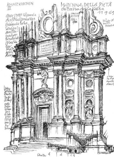
Palermo, Fassade der Pietà-Kirche von Giacomo Amato, begonnen 1689. Feldskizze von Paul Hofer aus «Taccuino Siciliano» 1969.

Für Paul Hofer ist die Geschichtsforschung nie Selbstzweck: «...Geschichte ist nicht Historie, sondern eine andere, mächtige Dimension der Gegenwart» (1963). Folgerichtig ist das Erarbeitete nicht Endpunkt, sondern Basis für vielfältige Unternehmungen. Als unbequemer Mahner bemüht er sich, die historische Substanz vor Abbruch und Verstümmelung zu bewahren. Er betreibt Denkmalpflege längst vor ihrer Institutionalisierung in Bern. Er bleibt nicht allein: Neben anderen Kulturhistorikern sind es junge Architekten, die bereits 1954 (erfolgreich) mitstreiten, um acht Altstadt Häuser in Bern zu retten. Hofer schreibt dazu: «Die Einsicht muss allgemein werden, dass sich Bejahung kompromisslos zeitgenössischer Architektur und