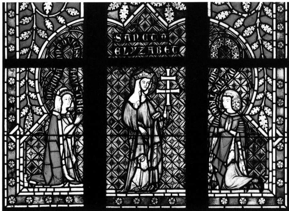
Königsfelden, Die hl. Elisabeth von Thüringen zwischen den Stiftern, Herzog Albrecht II. und seiner Gemahlin Johanna von Pfirt, im Johannes-/Katharina-Fenster (n III), um 1325/30.

Schliesslich sind auch im Anna-Fenster habsburgische Präferenzen eng mit solchen der Franziskaner verbunden. In den Müttern Anna und Maria verehrten die Klarissen ihre liebsten, zu Christus hinleitenden Heiligen. Das Haus Habsburg war seinerseits am frühen Anna-Kult beteiligt: mit den Vornamen einer Grossmutter und der älteren Schwester (gestorben 1326) der Königin Agnes. Der hl. Ludwig von Toulouse war ein hochverehrter Franziskanerheiliger, zugleich (als ein Anjou) ein Verwandter der Habsburger. 1274 geboren, 1297 gestorben, schon 1317 kanonisiert, gehörte er noch fast zur Generation der Stifterfamilie; er ist hier offenbar erstmals nordseits der Alpen dargestellt. Von den acht heiligen Jungfrauen (in den Zwickeln) hatten einige in habsburgischem Gebiet das Zentrum ihrer Verehrung, so Verena in Zurzach, Ottilia im Elsass, Christina in St. Chrischona.