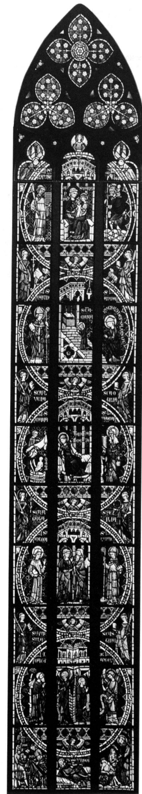
Königsfelden, Leben der hl. Anna (n VI) mit den hll. Antonius von Padua und Ludwig von Anjou (2. Geschoss) und hl. Jungfrauen in den Seitenschiffen, um 1330/40.

Die Kunstdenkmäler des Kantons Aargau III, Königsfelden , von EMIL MAURER, Basel 1954. – EMIL MAURER, Habsburgische und franziskanische Anteile am Königsfelder Bildprogramm (1959), in: ders., 15 Aufsätze zur Geschichte der Malerei , Basel 1982, S. 9–20. – RÜDIGER BECKSMANN, Fensterstiftungen und Stifterbilder in der deutschen Glasmalerei des Mittelalters , in: Vitrea dedicata , hrsg. v. der Stiftung Volkswagenwerk Hannover, Berlin 1975, S. 65–85. – Die Zeit der frühen Habsburger, Dome und Klöster 1279–1379 , Katalog zur Ausstellung in Wiener Neustadt, Wien 1979.