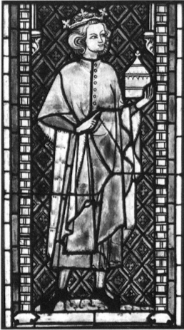
Königsfelden, Der junge König Kaspar aus der Anbetung der hl. Drei Könige (n II) – wie ein habsburgischer Prinz, um 1325.

Die Stifter präsentieren sich in zeitgenössischer höfischer Kleidung. Porträts wird man – damals, in der Glasmalerei – nicht erwarten; jugendliche Idealität zeichnet die Köpfe aus, kaum anders als in den sakralen Erzählungen.