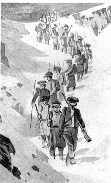
Rodolphe Töpffer, «Descente mémorable», Detail, album du «Voyage à Chamonix...», 1830.