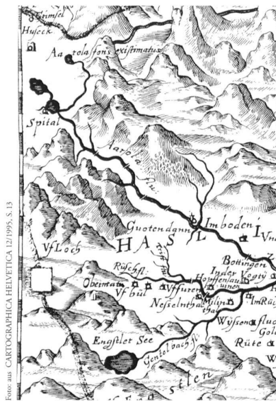
Ausschnitt aus der Karte des bernischen Staatsgebietes 1638 von Joseph Plepp.

Die Kartenspezialisten haben in jüngster Zeit organisatorische Strukturen geschaf-