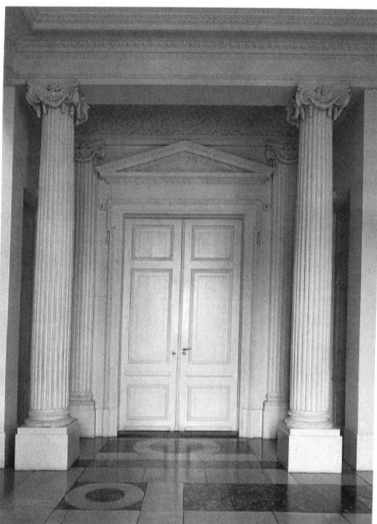
Basel, Haus zum Kirschgarten, 1775–1780, Blick vom Vestibül der Beletage zum Eingang des Grossen Salons.

Die Begleitpublikation zur Ausstellung Sehnsucht Antike , welche zwischen dem 17. November 1995 und dem 28. April 1996 im Haus zum Kirschgarten des Historischen Museums sowie der Skulpturenhalle Basel gezeigt wurde, nimmt sich einer grossen bisherigen Forschungslücke der Kunstgeschichte Basels an. Die vor rund zwanzig Jahren europaweit einsetzende Do-