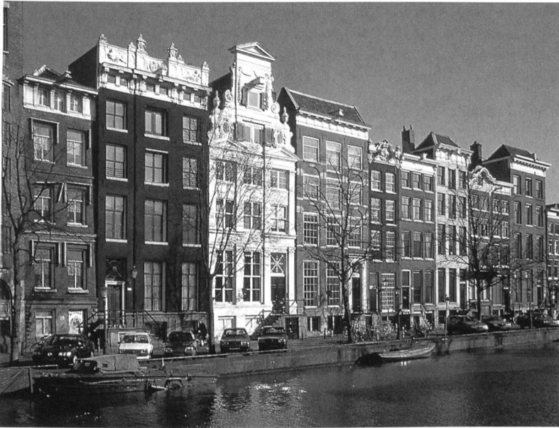
Amsterdam mit einer seiner malerischen Grachten.