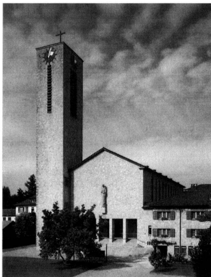
Die St. Laurentiuskirche in Flawil, 1935 vom Architekten Karl Zöllig erbaut.

Der Autor erläutert in gewohnt kompetenter Weise die verschiedenen Vorprojekte und Standortvarianten, geht auch auf das Umfeld ein und zeigt die in der Zwischenkriegszeit noch immer heftig geführte Auseinandersetzung um den «richtigen Stil» auf. Breiten Raum nimmt in seinem Essay die eigentliche Baugeschichte der neuen St. Laurentiuskirche ein. Es kommt dem in Flawil aufgewachsenen Anderes zugute, der Enkel des Architekten zu sein und somit auch über einen persönlichen Zugang zum behandelten Objekt zu verfügen. Das Projekt zur St. Laurentiuskirche war anfänglich heftigster Kritik ausgesetzt und spaltete die Gemeinschaft der Kirchbürger. «Kriegsstimmung liegt über den erregten Gemütern unserer Kirchgenossen», hiess es zwei Tage vor der entscheidenden Versammlung. Statt an armseligen Nachkriegsbauten in Deutschland sollte man sich doch an der jüngsten «schönen»