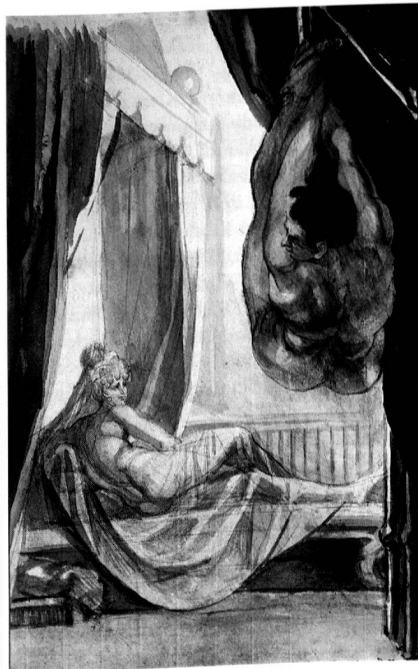
Johann Heinrich Füssli, Brunhild betrachtet den von ihr gefesselt an der Decke aufgehängten Gunther , Nibelungenlied X, 648–650, 1807, Bleistift und Feder, laviert, 483×317 mm, City Museum and Art Gallery, Nottingham.

Auf dem Boden der heutigen Gemeinde Flawil (Kanton St. Gallen, Bezirk Untertoggenburg) sind schon im Mittelalter zwei religiöse Zentren – in Oberglatt und im sog. «Kirchhof» – belegt. Der Kirche in Oberglatt kam grössere Bedeutung zu, da der Grossteil der Bevölkerung sowie die Bewohner des benachbarten Degersheim dort kirchgenössig war. Nach der Reformation wurde das Oberglatter Gotteshaus paritätische Simultankirche und diente bis in die zweite Hälfte des 18. Jahrhunderts beiden Konfessionen als Versammlungsort. 1771 kam es zur Auflösung des Simultanverhältnisses, und die Katholiken verlegten ihren Gottesdienst von dem in einer Senke