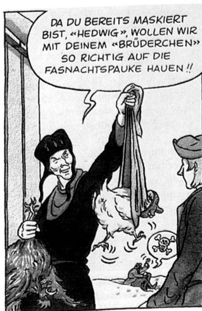
Zum Thema «Sitten und Bräuche im alten Zürich»: die «Fasnachtsbühner».

Wie die Grenzsymbole einer Barocklandschaft erheben sich die monumentalen Abteien von St. Urban, Muri und Einsiedeln unweit der bernischen und zürcherischen Regionen. Und wenn man weiter in die Innerschweiz eindringt, werden sich fast überall Dorfkirchen in barockem und frühklassizistischem Stil finden, in einer mit Kapellen, Bildstöcken und Kreuzen sakralisierten Natur. Den wenigen ummauerten Städten steht als Siedlungsgestalt der in seiner Erscheinung halbstädtische «Flek-