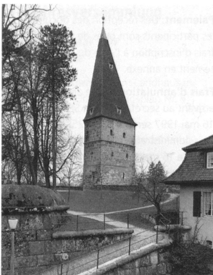
Solothurn, Krummturm, 13./15. Jahrhundert.

Die Aare war Anlass zur Gründung des römischen Salodurum gewesen, und mit dem Fluss blieb Solothurn bis heute schicksalhaft verbunden. Der Rundgang widmet sich städtebaulichen Aspekten einer Flusstadt; wir besichtigen dabei u.a. den Rollhafen (1697) und das Landhaus (1720). Eine gewaltige Herausforderung bildete früher die Zuleitung und Verteilung des Trinkwassers und des Bachwassers für die Energiegewinnung. Wir spüren alte Wasserführungen auf und besuchen die alten Brunnen, insbesondere die prächtigen Figurenbrunnen des 16. und 17. Jahrhunderts.