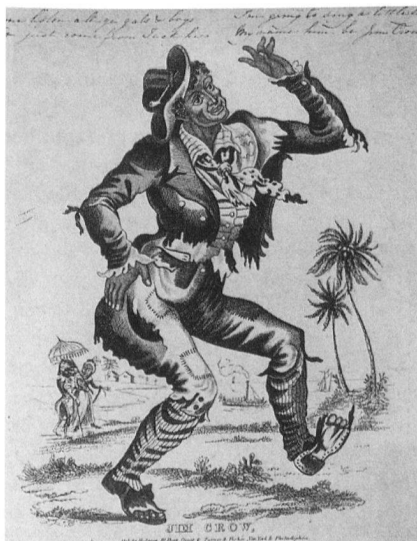
Anonym, Jim Crow , um 1830, Stich, 20,9 × 17,1 cm.

Zuhörer, die der traurigen Ballade vom Schicksal der Mary Blane lauschen, in nachdenklichem Ernst. Mit ihren Kleidern durchstreifte Buchser die verschiedenen sozialen Gesellschaftsschichten: Vom nackten Jungen über die zerrissenen Lumpen der Figur in der Mitte, dem typischen «ragamuffin», wechselte er bei der Zuhörerinnen links zu einem schlichten aber unverfälschten, hellblauen Kleid, das er bei der Mulattin vorne rechts mit einem weissen Rüschenkleid mit roten Schleifen überbot. Mit passender Haarschleife und einem Schmucksatz aus doppelt gereihter Halskette, zugehörigem Armband und Ohrhängern kürte Buchser ausgerechnet die Mulattin zur gepflegtesten Frau im Bild. Trotz ihres «weissen Blutes» wurde sie von der amerikanischen Gesellschaft genauso auf die unterste Hierarchiestufe gesetzt. Diese kritische Anspielung überblendete Buchser mit einer erotischen Komponente, die er in vielen anderen Werken aus den USA und Nordafrika viel deutlicher zum Ausdruck brachte. Somit wird auch sein Aufgreifen des Stereotyps der Octoroon zweiseitig.