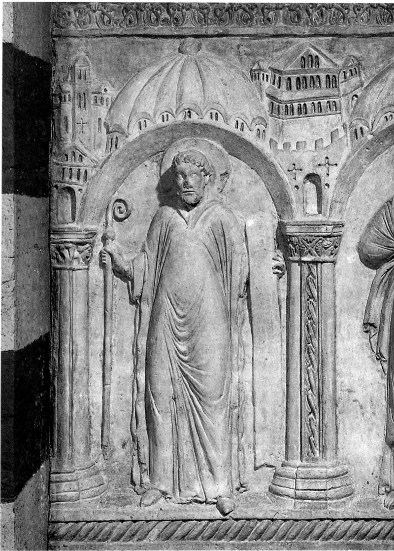
6 Hildesheim, St. Michael, nördliche Chorschranke mit dem hl. Benedikt, Stuck des 13. Jahrhunderts. Auf die gemauerte Schranke wurde Gips angetragen und nachgeschnitten. Von der ursprünglichen Fassung sind nur noch Reste erhalten.

weiss gefassten, mehrfach übertünchten Stuck nicht bis auf die erste Fassung freizulegen. Auch die zweite Fassung vermag die Qualität des Stucks ausreichend zur Geltung zu bringen.