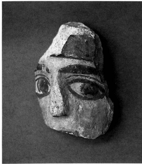
2 Kloster Disentis, Stuckrelief eines aus Sumpfkalkmörtel modellierten Kopfes, vermutlich 8. Jahrhundert. Er zeigt die in Freskotechnik bemalte, konservierte Originalfassung.

Im Mittelalter wurden zwei Gipsarten für die Verarbeitung von Gips verwendet. Als erste Gipsart diente das sogenannte Halbhydrat , das durch Brennen des natürlich vorkommenden Gipses bei 120–190 °C gewonnen wird. Mit Wasser angesetzt, härtet es innerhalb von 20–30 Minuten aus und ergibt eine nahezu weisse, relativ weiche und leicht abzuschabende Masse. Die Abbindezeit lässt sich durch