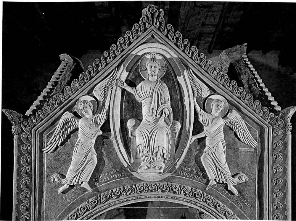
5 Civate (Como), Basilica di S. Pietro al Monte, Ciborium im Westchor, Südansicht mit Christus in der Mandorla, Stuck mit hochgebranntem Gips in Auftragstechnik, 11. Jahrhundert. Bei der Restaurierung der 90er Jahre trat die grossflächig erhaltene Originalfassung zutage.

ergänzt oder ersetzt. Seine Arbeiten beschränkten sich auf das Ausbauen loser Stuckteile, das Zurückfixieren mit Gips oder Zurrückschrauben, das Entfernen der Übertünchungen und der Farbfassung mit Spachteln und Lanzetten. Stuck aus Gips-/Kalkgemisch 1 oder Kalkmörtel ist jedoch äusserst leicht verletzbar und wurde mit dieser Methode zerkratzt. Die dadurch verlorene Form der Oberfläche und nicht mehr ins Niveau gebrachte, nachgeschnittene und eingesetzte Teile wurden neuen Aufmodellierungen angepasst. Damit ging der originale künstlerische Formenausdruck einer Stukkatur oft verloren.