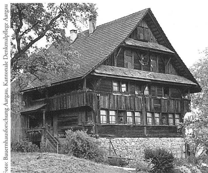
Boswil, Wohnhaus aus dem 18. Jahrhundert mit originaler Fenstersituation, Aufnahme 1989.

In der Darstellung der Siedlungslandschaft beschränkt sich der Verfasser auf die Präsentation ausgewählter Höfe, Weiler und weniger Dorfanlagen. Dabei war eine umfassende, zu den Anfängen der Siedlung zurückreichende Beschreibung, insbesondere der Dörfer, weder beabsichtigt noch möglich. Das Hauptaugenmerk der Siedlungsanalyse richtet sich auf die Verhältnisse im 19. Jahrhundert und erfolgt anhand einer Auswertung von Gebäudeversicherungsregistern. Mit statistischen Mitteln, ergänzt durch eindrückliche Fotos, entsteht so ein interessantes Bild der Siedlungszusammensetzung nach Zahl und Funktionen der Gebäude, ihrer Materialisierung, aber auch über Zeitpunkt und Ausmass von Veränderungen. Einen wichtigen Aspekt bilden die das Ortsbild prägenden Dachformen und Bedachungsmaterialien.