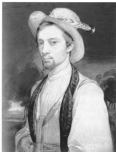
Charles Gleyre, autoportrait, vers 1829, aquarelle sur papier, 24,7 × 18 cm, Lausanne, Musée cantonal des Beaux-Arts.

Le critique d'art français, ami de l'artiste, avait mené une première enquête qui déboucha sur une biographie extrêmement bien documentée. L'historien de l'art américain retrace la biographie de Gleyre en mettant l'accent sur la genèse et la réception de ses œuvres, qu'il expose en utilisant de multiples sources inédites qui cernent l'artiste, comme autant d'indices et de pistes. Ch. Clément comme W. Hauptman soulignent l'importance des facteurs psychologiques, mais le second innove en inscrivant les angoisses récurrentes de Gleyre dans l'histoire de la mélancolie artistique au XIXe siècle et dans la fortune iconographique de ce thème romantique par excellence. W. Hauptman est l'auteur d'une thèse sur ce sujet (1975), qui consacre plusieurs pages à l'œuvre clef du peintre, Les illusions perdues (1843). Gleyre a par ailleurs fait l'objet de divers catalogues d'exposition et articles, ainsi que d'une thèse de Lilien Robinson (1978), et d'un livre de Michel Thévoz intitulé L'académisme et ses fantasmes. Le réalisme imaginaire de Charles Gleyre (1980) – essai qui propose une lecture de l'œuvre de Gleyre, intégrant psychanalyse et sociologie de manière stimulante.