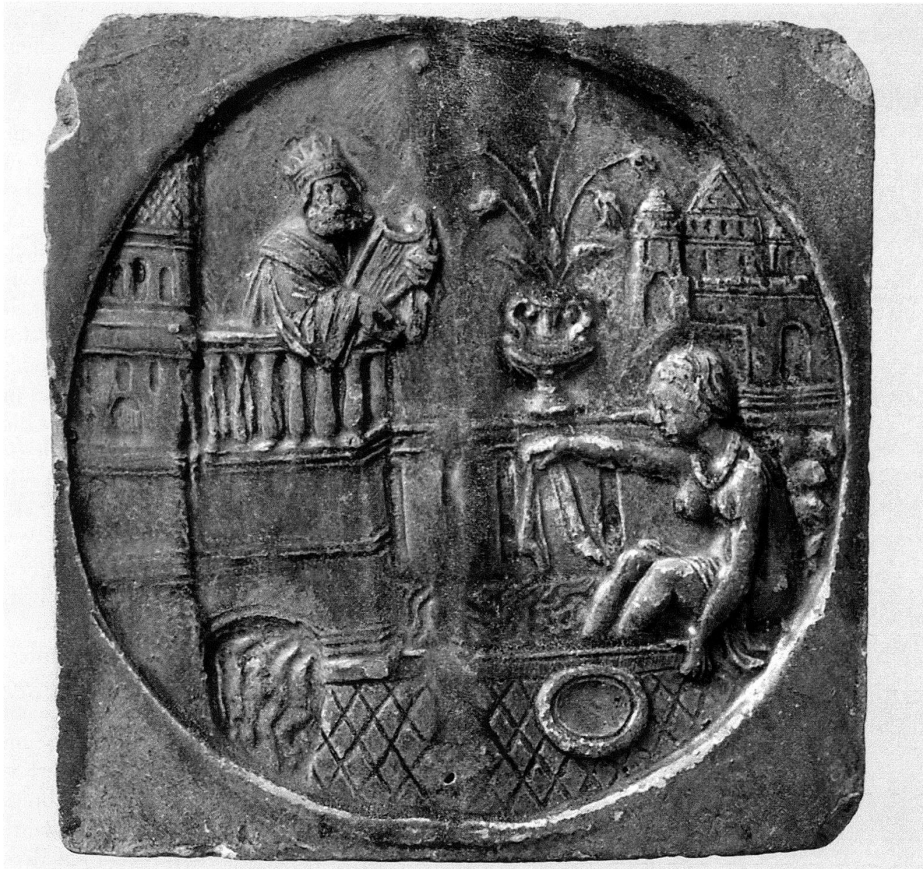
7 Ofenkachel mit der Darstellung von David und Bathseba, 2. Hälfte 16. Jahrhundert, 17,5×17,5 cm, Kachelblatt leicht gewölbt, grüne Glasur gering beschädigt, Privatbesitz. – Auch diese Kachel mit der im 16. Jahrhundert beliebten Badeszene dürfte auf eine Vorlage Hans Sebald Behams zurückgehen.