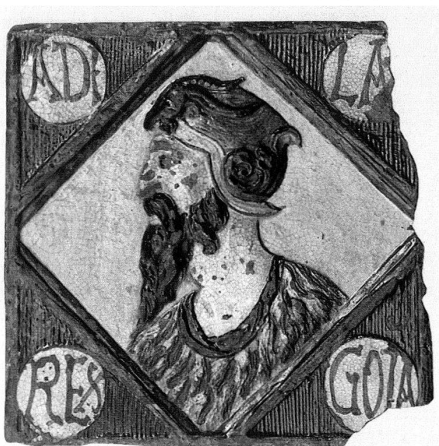
12 Ofenkachel mit der Darstellung Attilas, 2. Hälfte 16. Jahrhundert, 21×21 cm, am rechten Rand beschädigt, Schweizerisches Landesmuseum Zürich LM 3405.37. – Die Büste Attilas ist durch die Beschriftung in den Zwickelmedaillons erläutert.