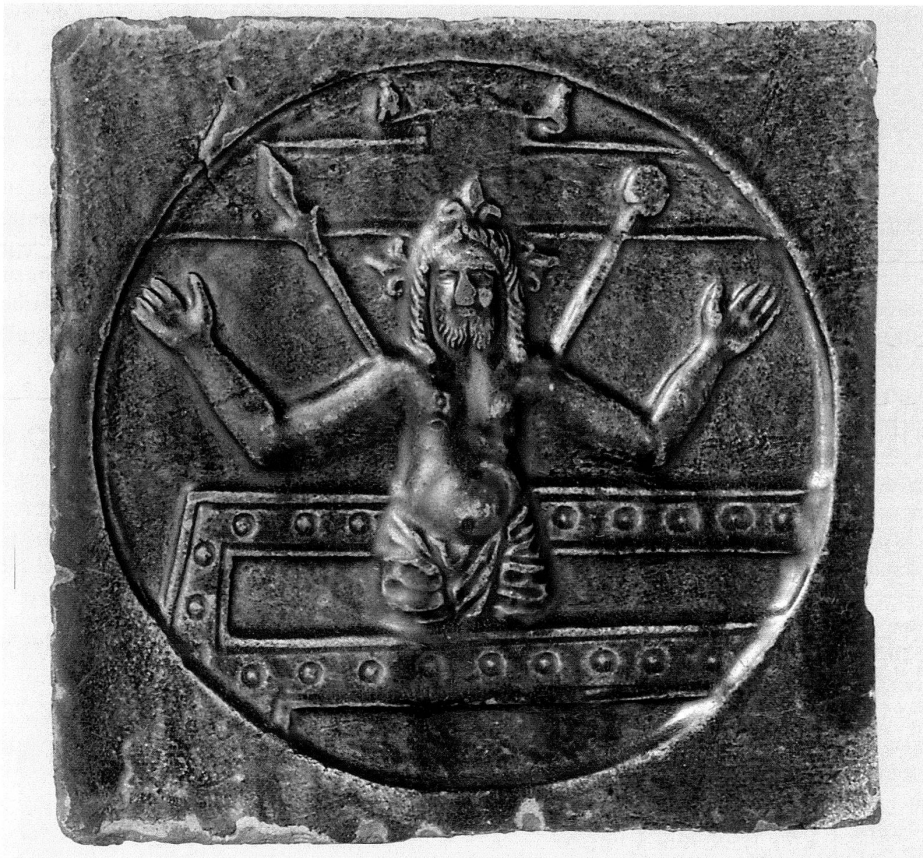
8 Ofenkachel mit der Darstellung von Christus als Schmerzensmann aus der Tumba steigend, 2. Hälfte 16. Jahrhundert, 18×18 cm, grüne Glasur, Kachelrumpf abgebrochen, Historisches Museum Luzern, HMLU 1378. – Die Darstellung ist eher ungewöhnlich und bislang auch auf keine druckgrafische Vorlage zurückzuführen.