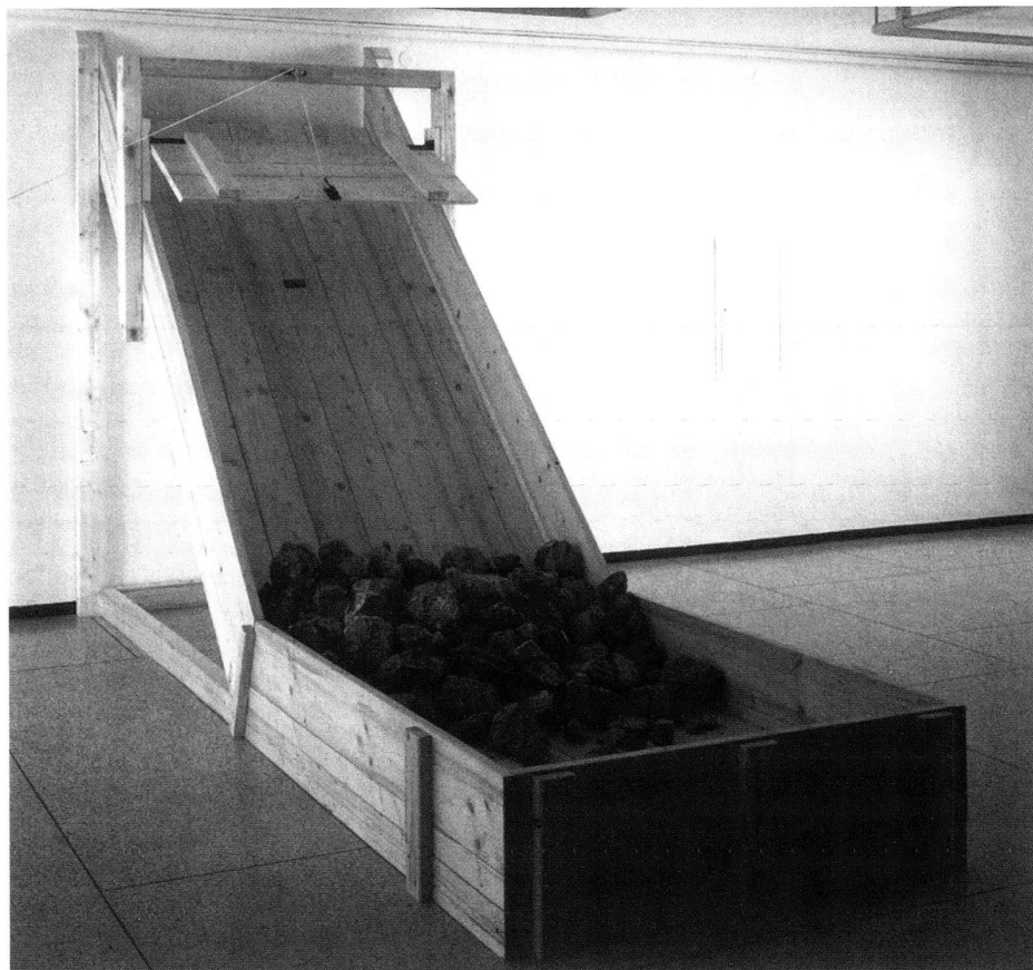
3 Roman Signer, Bergsturz , 1987, Holzkonstruktion mit Schnurzug und Verschluss- mechanismus, Steine, 275×140×425 cm, Friedrichs- hafen, Städt. Bodensee-Mu- seum.