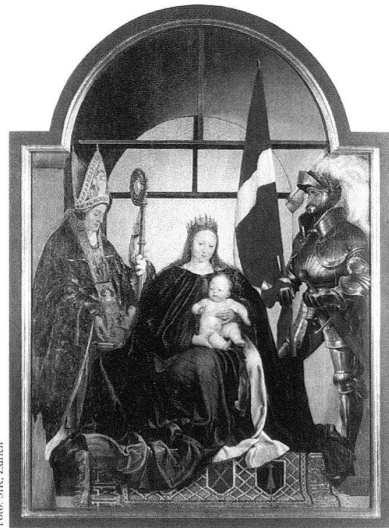
Hans Holbein d.J., Solothurner Madonna , 1522, Lindenholz, 140,5×102 cm, Solothurn, Kunstmuseum.

Die Schlichtheit der Bildarchitektur und der Figurenposes wird besonders deutlich,