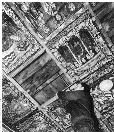
Illustration aus dem besprochenen Buch