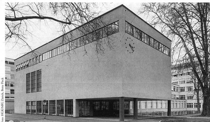
Zürich, Hochschule für Gestaltung und Kunst und Museum für Gestaltung, erbaut 1930–1933 von Adolf Steger und Karl Egender, Ansicht des Museumseingangs nach Abschluss der Aussenrestaurierung im Jahr 1999. – Die originale Beschriftung «Kunstgewerbeschule – Museum» des Grafikers Alfred Keller wurde anlässlich der Restaurierung entfernt.

Substanz schonende und materialgerechte Sanierungen sind ohne ein interdisziplinär arbeitendes Team aus Bau-träger-schaft, Nutzer, Architekt, spezialisierten Ingenieuren und der Denkmalpflege und