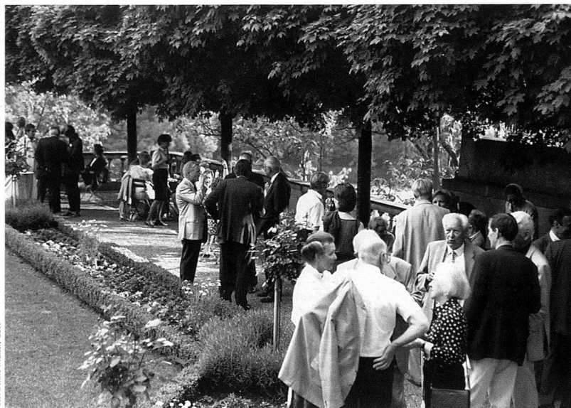
Generalversammlung 1999 in Bern. Bei strahlendem Wetter geniessen die anwesenden Mitglieder und Gäste den von der Stadt Bern offerierten Aperitif im Erlacherhof.