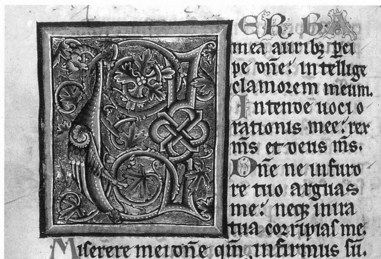
4 Initiale V[erba mea auribus] zum Beginn des Hieronymuspsalters, um 1260, aus dem Psalter Besançon, Bibliothèque Municipale, Ms. 54, fol. 169v, 82×75 mm. – Der Hieronymuspsalter gehört wie der Marienpsalter zu den paraliturgischen Gebetssammlungen, welche diese Handschrift in ungewöhnlicher Weise bereichern.