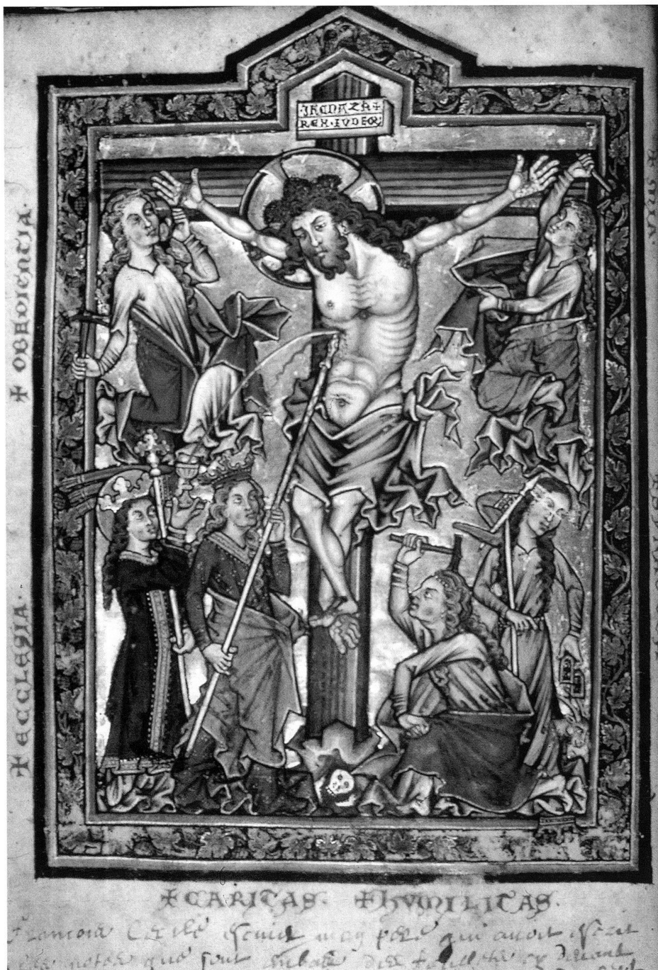
5 Kreuzigung Christi durch die Tugenden, Miniatur auf Goldgrund, um 1260, aus dem Psalter Besançon, Bibliothèque Municipale, Ms. 54, fol. 15v, 204×143 mm. – Das ungewöhnliche Thema der Tugendenkreuzigung ist im monastisch-zisterziensischen Bereich verankert und tritt als eigentliches Andachtsbild häufig in Handschriften für Frauen auf.

Liebe Christi teilzuhaben. 44 In meditativer Betrachtung von Andachtsbildern wie der Tugendenkreuzigung mit Caritas als Sponsa konnten die Nonnen das Handeln der Braut Christi nachvollziehen, genauso, wie sie das Wirken Christi durch die Evangelien nachleben konnten: Zur imitatio Christi kommt die imitatio sponsae . 45