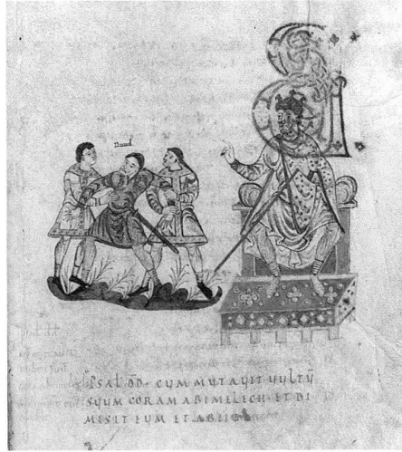
5 Psalterium aureum , St-Gall, Stiftsbibliothek, cod. 22, psaume 56, p. 132, vers 860. – Saül poursuit David qui se réfugie dans une caverne. Une main du XIII e siècle a cru nécessaire de pourvoir les protagonistes de leur nom.