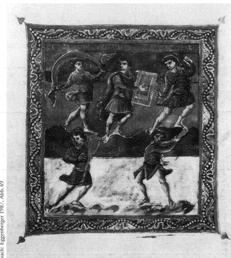
nach: Eggenberger 1987, Abb. 49

Les deux dernières études qui ont cherché à élucider ces énigmes ont des approches fort différentes. Eggenberger, dans une analyse iconographique, part de l'idée qu'il s'agit d'un cycle unifié, réalisé à St-Gall par un artiste autochtone qui s'inspire de l'imagerie impériale carolingienne. Il pense que chacune des douze images – qui disposent de modèles stylistiques différents qu'il a pu établir – a sa place dans un programme fort complexe qui joue sur la symbolique des nombres et le rapport typologique entre David, le Christ et le souverain. L'onction de David est représentative (psaume 26). Typologiquement, on y voit le baptême du Christ. Par ailleurs, l'onction du souverain, sa légitimation par la main papale, est une tradition que Pépin le Bref fut le premier à réintroduire dans le cérémoniel carolingien. Eggenberger conclut avec la proposition que le psautier était destiné au monarque en visite à l'abbaye, lui permettant ainsi de suivre l'office canonial. Deux dates sont dès lors possibles: la présence à St-Gall de Charles le Gros en 883, ou celle de Conrad I en 911. L'auteur