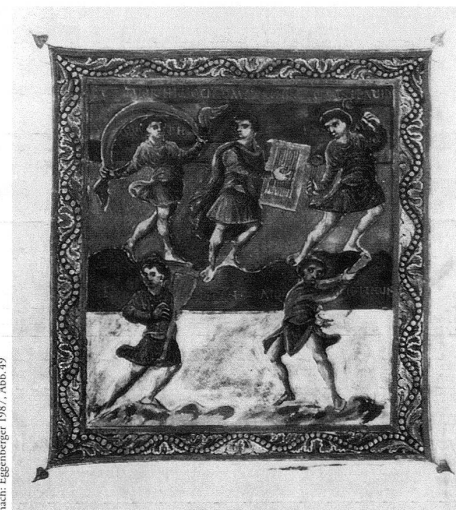
nach: Eggenberger 1987, Abb. 49

Les deux dernières études qui ont cherché à élucider ces énigmes ont des approches fort différentes. Eggenberger, dans une analyse iconographique, part de l'idée qu'il s'agit d'un cycle unifié, réalisé à St-Gall par un artiste autochtone qui s'inspire de l'imagerie impériale carolingienne. Il pense que chacune des douze images – qui disposent de modèles stylistiques différents qu'il a pu établir – a sa place dans un programme fort complexe qui joue sur la symbolique des nombres et le rapport typologique entre David, le Christ et le souverain. L'onction de David est représentative (psaume 26). Typologiquement, on y voit le baptême du Christ. Par ailleurs, l'onction du souverain, sa légitimation par la main papale, est une tradition que Pépin le Bref fut le premier à réintroduire dans le cérémoniel carolingien. Eggenberger conclut avec la proposition que le psautier était destiné au monarque en visite à l'abbaye, lui permettant ainsi de suivre l'office canonial. Deux dates sont dès lors possibles: la présence à St-Gall de Charles le Gros en 883, ou celle de Conrad I en 911. L'auteur