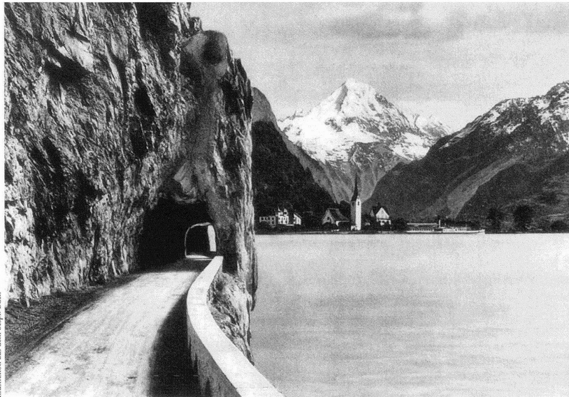
Illustration aus dem bespr. Buch

Im Jahr der Krönung Napoleons I. 1804 geboren, entstammte der Jüngling mit mathematischem und philosophischem Talent, wie ihn ein Kamerad und späterer Schulheiss von Luzern eingeschätzt haben soll, einer einflussreichen Altdorfer Familie mit ehernen Moral- und Sittenvorstellungen. Treffend beschrieb der französische Kunstgelehrte Raoul-Rochette in einem Brief der frühen 1820er Jahre das dortige Leben: «La promenade, la lecture et la pratique des devoirs religieux forment tous les divertissements des classes d'élevées.» Der früh verwaiste Spross beendete das Gymnasium in Solothurn, liess sich anschliessend in Heidelberg und von 1825 bis 1827 in Wien an der 1815 gegründeten Technischen Hochschule als Ingenieur für Strassen-, Brücken- und Wasserbau ausbilden. Das Aufkommen der Industrialisierung und der Ausbau