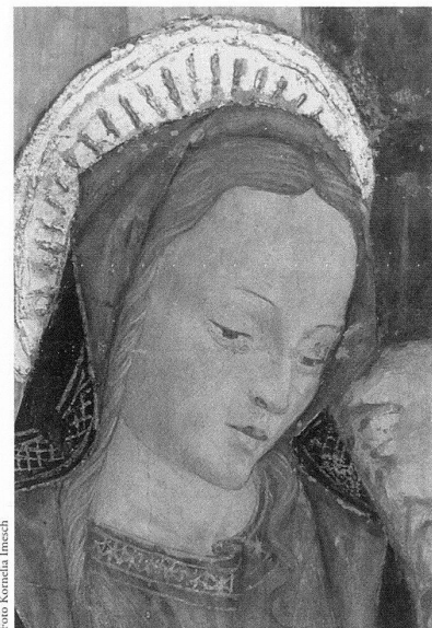
Bellinzona, S. Maria delle Grazie, Lettnerwand, Anbetung der Drei Könige, Teilansicht der Muttergottes.

Die Informationen dieses ersten Kapitels bilden den Ausgangspunkt für die Arbeit, deren Ziel die Autorin so beschreibt: «Ich gehe davon aus, dass Stil und Inhalt sich gegenseitig bedingen; dass somit jeder Stil nicht nur spezifisch konnotiert, sondern auch mit einer ganz bestimmten Aussage verbunden ist und im Dienst der Funktion und Bedeutung des Werks steht. Deshalb habe ich für die Untersuchung des Bellinzoneser Freskenzyklus ein methodisches