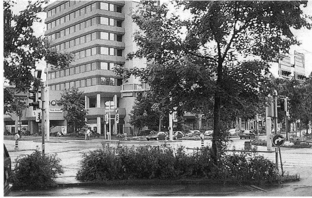
2 Die erste Fotografie, die Fischli/Weiss für ihr Fotobuch «Siedlungen, Agglomeration», 1993, ausgewählt haben, zeigt die Schaffhauserstrasse am Ortsausgang von Opfikon in Richtung Kloten. – Hier abgebildet ist die Situation in einer fotografischen Aufnahme von Wolfgang Kersten mit einem 50mm-Objektiv vom 2. August 2000, 16.30 Uhr, bei leichtem Regen.