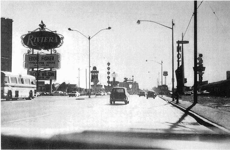
6 Der Strip von Las Vegas, Blick nach Südwesten, Abbildung aus: Robert Venturi, Denise Scott Brown, Steven Izenour, «Lernen von Las Vegas. Zur Ikonographie und Architektursymbolik der Geschäftsstadt», Braunschweig/Wiesbaden 1979, S. 14. – Die Perspektive, aus der Fischli/Weiss die Fotografien für «Siedlungen, Agglomeration» aufgenommen haben, gleicht Robert Venturis Blick entlang der Strassen von Las Vegas.