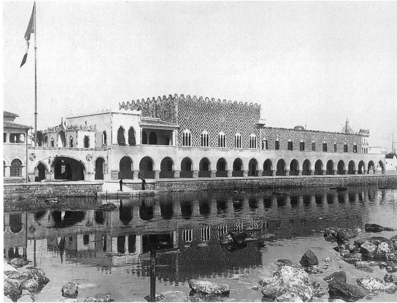
Rodi, Palazzo del governo (attuale sede della prefettura), costruito nel 1926–27 su progetto di Florestano di Fausto. Veduta della facciata orientale in un'immagine degli anni Venti.

Das der aus diesen Überlegungen heraus entstandene Text nicht chaotisch wurde, liegt an den sorgfältig aufgearbeiteten Quellen und dem in anschauliche Zusammenhänge gebrachten Material. Dieses wird der Leserin und dem Leser oft in anekdotisch aufgemachten Episoden nähergebracht, die von besonderem Interesse und Gespür für soziale Konstellationen zeugen. Das Buch eignet sich insofern weniger zum Nachschlagen denn als kurzweilige, informationsreiche Lektüre. Neben den historischen und biografischen Ausführungen nehmen Beschreibung, Analyse und Interpretation von Bauten und Projekten einen wichtigen Platz ein. Diese sorgfältige Lektüre gestattet die Überprüfung von Sprünglis Architektur auf ihre formalen und sprachlichen Möglichkeiten und mündet folgerichtig in eine Kritik von Paul Hofers linguistisch inspiriertem Erklärungsmodell der «Aussenfront als Syntax». Freilich: Dass der grosse Kenner (und Geniesser) Hofer ausgerechnet auf Sprünglis Systematik pochte, während nun ausgerechnet ein Analytiker wie Schnell auf dem irrationalen Moment im Werk des Architekten insistiert, relativiert