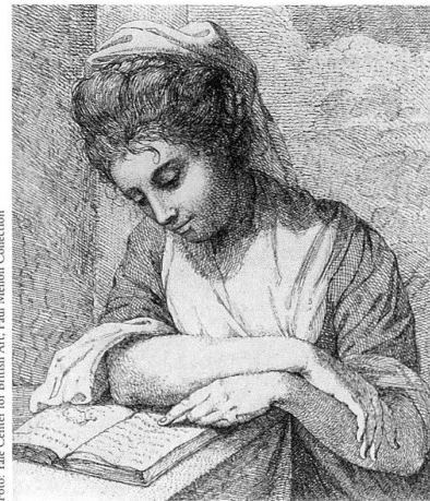
Angelika Kauffmann, Mit Zeigefinger Lesende , Radierung, 1770, 27,7 × 24,2 cm (Blatt), Yale Center for British Art, Paul Mellon Collection.