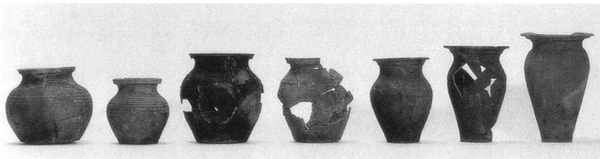
Gefässe aus Basel, ausgehend des 13. und erste Hälfte 16. Jahrhundert (v. l. n. r.) – Entwicklung der Topfformen von bauchig gedrungen bis hoch und schlank.