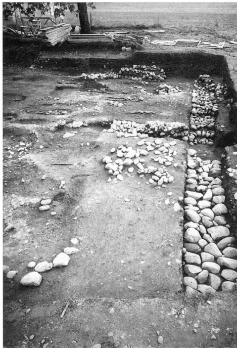
2 Le site archéologique de Saint-Mathieu de Vuillonmex. – Au premier plan, maçonnerie correspondant à l'annexe adossée contre le chœur de l'église occidentale édifiée dans le courant du XI e siècle.

En Suisse, on considère généralement que, dès Néron, et surtout sous Vespasien (élévation d'Avenches au rang de colonie), les constructions en torchis sur clayonnage et sablières basses ont cédé du terrain devant la maçonnerie, qui respecte toutefois la disposition et l'orientation des bâtiments précédents 5 . Ceci est observable entre autres à Augst, Vidy, Avenches, Baden, Oberwinterthur 6 . Ainsi, en tout temps, on voit que les traditions indigènes ont survécu et même cohabité avec les bâtiments en maçonnerie de type romain. A Riom-Parsonz GR, on a retrouvé des petites constructions de type local, en pierres sèches et poteaux de bois, édifiées à côté de maisons romaines. Et dès la fin du Bas-Empire, l'usage du bois est attesté pour les villes qui gagnent alors en importance (Coire, Eschenz, Soleure,