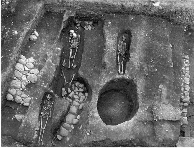
3 Le site archéologique de Saint-Mathieu de Vuillonex. – Vue plongeante sur la nef de l'église orientale avec les vestiges des fosses-silos, des sépultures et des maçonneries appartenant à l'église médiévale.

Sur le territoire de l'actuel canton de Genève, quatre églises ont été découvertes. Le prieuré de Saint-Jean date du VI e siècle. Il se maintient durant quatre siècles, ce qui constitue une durée exceptionnelle pour une église en bois. Les poteaux ont dû, bien sûr, être plusieurs fois remplacés et le chœur a été transformé. Ce chœur de forme quadrangulaire (13 m) a été agrandi vers l'est. Son sol abritait quatre tombes en dalles et regulae (tuiles plates) des VI e –VII e siècles 9 . La porte sud a été localisée grâce aux traces des poteaux soutenant le porche. De même, un autel appartenant au premier état de la construction a été identifié grâce à un trou de poteau central entre la nef et le chœur. Une église en pierre