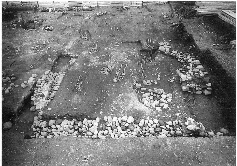
1 Le site archéologique de Saint-Mathieu de Vuillonex, une église en bois édifée au X e siècle. – Dégagement du chœur de l'église occidentale.

Dès La Tène II (environ 250 avant J. C.), les outils et les techniques de travail se diversifient (ciseaux, gouges, clous en fer, etc.) 2 . Les Romains introduisent quelques techniques nouvelles, telles que la charpente triangulaire et l'assemblage chevillé des arbalétriers 3 . Ils apportent également des outils comme la scie à