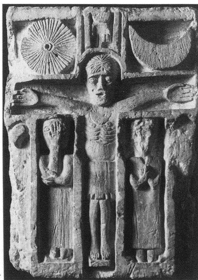
Repro. S. 161