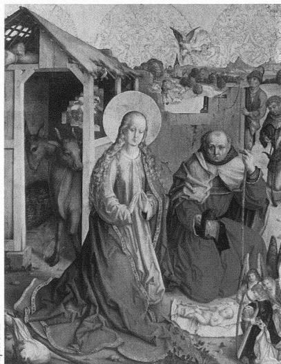
Hochaltar der Franziskanerkirche in Freiburg i. Ü., Die Geburt Christi, Holz, 207,4 × 165,4 cm.