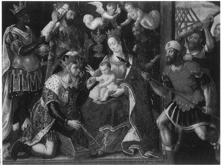
Repro. S. 310 Anonymer Meister, Ikonoklastische Szene mit einer Anbetung der Könige, Öl auf Holz, 104×140 cm, Flandern, Ende 16. Jh., Musée de la Chartreuse, Douai. – Für die Katholiken ist der Bildersturm ein Sakrileg gegen Gott, die Gottesmutter oder die Heiligen.

Dieses ehrgeizige Ziel erforderte eine umfassende Visualisierung sowohl der unendlich vielfältigen Funktionen von Bildern aller Art in vorreformatorischer Zeit als auch der Folgen der Bilderfeindlichkeit in der protestantischen Kirche. Wie die Ausstellung ist auch der Katalog thematisch aufgebaut. Die Einordnung der 234 Exponate erfolgt deshalb nicht nach rein chronologischen oder kunsthistorischen Kriterien, sie werden vielmehr in ihren ursprünglichen Sinnzusammenhang gestellt und sachkundig kommentiert. So vermitteln sie oft überraschende Einsichten in die Hintergründe des Bilderkults und seiner Verwerfung, wie dies meines Wissens noch nie in einer Ausstellung versucht worden ist. Die Erklärungen zeugen im Allgemeinen von grosser Sensibilität, die allerdings in der heutigen bildbesessenen Zeit und bei schwindender konfessioneller Verkrampfung leichter zu gewinnen ist als ehemals. Umso störender wirkt dann der trendige Griff in die sexologische Mottenkiste zur Deutung der Christus-Johannes-Gruppen