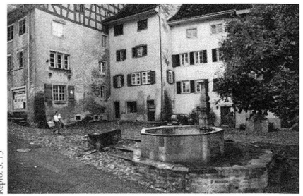
Der Widderbrunnen auf dem ehemaligen Fischmarkt in Kaiserstuhl.

Das ehemalige Kloster St. Johann im Thurtal , Daniel Studer , 36 S., Nr. 709, CHF 9.–. – Vor der Mitte des 12. Jahrhunderts gründeten Benediktiner Mönche in Alt St. Johann ein Kloster, das bis in das frühe 17. Jahrhundert Bestand hatte und 1629 nach Neu St. Johann verlegt wurde. Die Pfarrkirche St. Johann mit der angebauten Propstei, die St. Johannes-Kapelle und auch die evangelische Kirche gehen direkt auf die ehemaligen Klostergebäude zurück. Verschiedene, noch heute feststellbare Bauphasen und Renovationen prägen die in den letzten Jahren sorgfältig restaurierte Sakralanlage im obersten Thur-