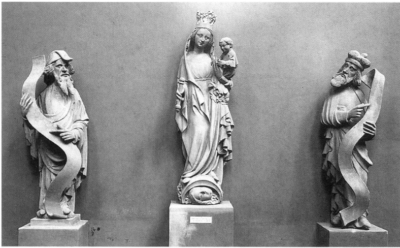
3 Basel, Spalentor, Figuren an der Feldseite des Hauptturms: Madonna mit zwei Propheten, Historisches Museum Basel.

an ottonische Kirchenbauten denken, die Gesamtanlage erinnert zudem an die Dreiturmgruppen karolingischer Westwerke.