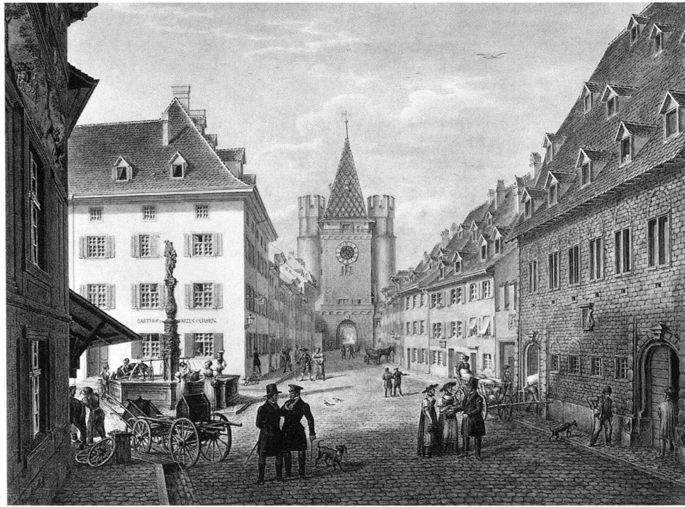
4 Johann Jakob Neustück, Die Spalenvorstadt mit dem Spalentor, Aquarell, 1854, Privatbesitz.