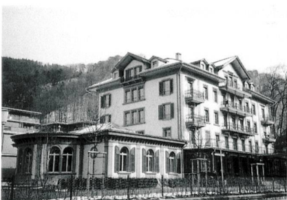
Thun, Salon de Réunion auf dem Bellevue-Areal. (A. Zellweger)

Merkmale der klassizistischen Fassaden sind das Zur-Schau-Stellen der Gäste auf den Balkonen und das Uhrtürmchen mit Wetterfahne auf dem Dach. Die Zeit und das Wetter gehörten zu den wichtigsten Aspekten eines Kur-aufenthaltes, wie auch das Promenieren und Sich-Begegnen in den Salons.