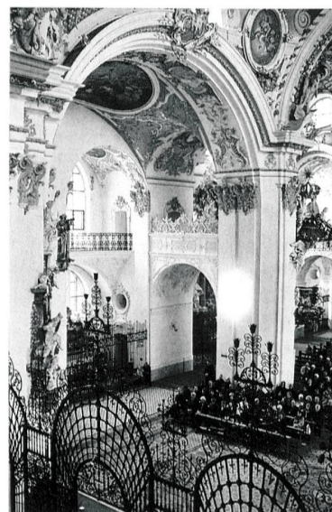
Die Jubiläumsfeier zum Erscheinen des 100. Kunstdenkmäler -Bandes in der Klosterkirche Einsiedeln. (GSK)

Eine weitere Buchpräsentation fand Anfang November im Zunfthaus zur Meisen in Zürich statt. Dort konnte bereits der 102. Band, der dritte der Neuausgabe über die Stadt Zürich, aus der Taufe gehoben werden.