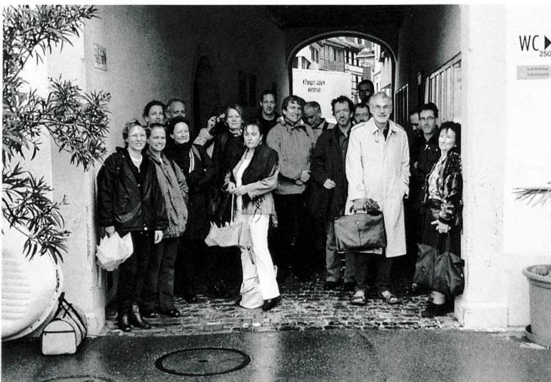
Tagung der Kunstdenkmäler-Autorinnen und -Autoren – ein Ausflug an den Untersee im Kanton Thurgau. (GSK)

La prossima assemblea generale si svolgerà il 5 giugno 2004 a Coira. Il programma è riportato nell'edizione 2004/1 di Arte + Architettura , distribuita lo scorso mese di febbraio. Saremmo pertanto lieti di ricevere ulteriori iscrizioni all'Assemblea.