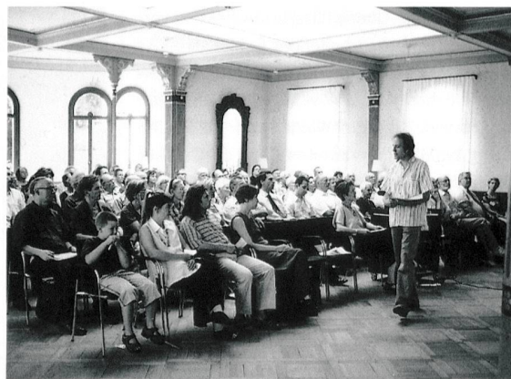
Die INSA-Buchvernissage in Thun. (GSK)