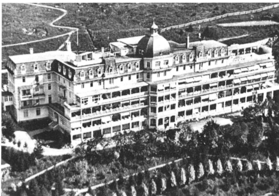
4 Sanatorium Valbella, Davos, in: INSA, Bd. 3, S. 413. – «[...] Äusseres Vorbild für das Sanatorium Berghof in Thomas Mann's «Zauberberg» (für das innere Vorbild vgl. Buolstrasse Nr. 3).» (S. 412)