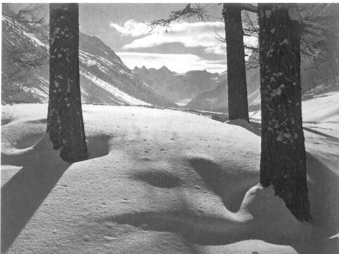
Albert Steiner, Winterlandschaft, undatiert.

bis 18. September 2005, Di–So, 10–17 Uhr, Do 10–20 Uhr. Bündner Kunstmuseum Chur, Postplatz, 7002 Chur, Tel. 081 257 28 68, www.buendner-kunstmuseum.ch