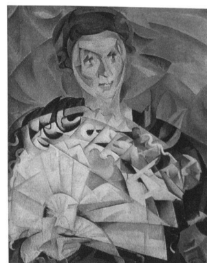
Alice Bailly, Femme à l'éventail, 1913, Musée cantonal des Beaux-Arts, Lausanne.

jusqu'au 15 janvier 2006, ma–me, 11h–18h, je, 11h–20h, ve–di, 11h–17h, fermé le 25 décembre 2005 et le 1 er janvier 2006. Musée cantonal des Beaux-Arts, Palais de Rumine, place de la Riponne 6, 1014 Lausanne, tél. 021 316 34 45, www.beaux-arts.vd.ch