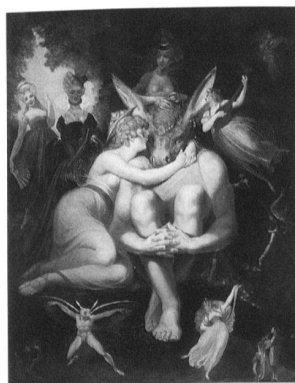
Johann Heinrich Füssli, Titania erwacht, 1793/94, Kunsthau Zürich.

bis 8. Januar 2006, Di–Do 10–21 Uhr, Fr–So 10–17 Uhr, 24./25.12. geschlossen, 26.12. und 1./2.1. 10–17 Uhr, 31.12. 10–15 Uhr. Kunsthau Zürich, Heimplatz 1, 8001 Zürich, Tel. 044 253 84 84, www.kunsthau.ch