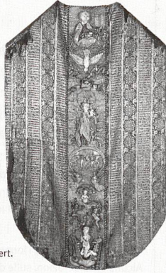
Kaseel. Islamisch-ägyptisches Seidengewebe, 14. Jahrhundert.

Neben bedeutenden Reliquiaren finden sich im Churer Domschatz auch zahlreiche liturgische Gewänder und textile Ausstattungsgegenstände für den kirchlichen Gebrauch. Die bedeutenden Kunstwerke gehören zur mittelalterlichen Ausstattung der Kathedrale Chur und der Kloster-Kirche St. Luzi.